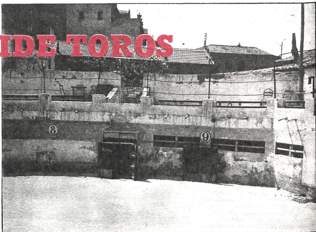
Hasta los pueblos más pequeños de Madrid cuentan entre los programas de las fiestas con una corrida de toros. La plaza es lo de menos, por supuesto

Las capeas vienen a salir por veinte mil pesetas, sin derecho a matar el ganado