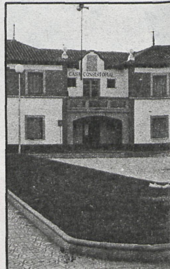
El Ayuntamiento de Mejorada dice «basta» en el tema urbanístico

La promotora COMMAR (Quinta San Fausto) no tiene proyecto de instalación ni en la primera, ni en la segunda fase, tampoco tiene proyecto de derribo, ni autorización para verter escombros en terrenos municipales. A pesar de todas estas infracciones, la actual Corporación ha querido ser flexible y negociar, en vista de que esta constructora tenía licencia de la anterior Corporación.