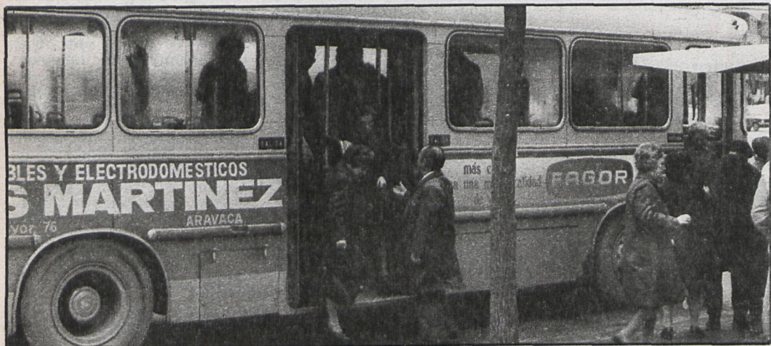
Vía libre hasta Getafe