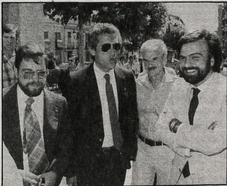
El presidente de la Junta de Andalucía recorrió las calles de la ciudad en compañía de alcaldes de diversos pueblos de nuestra provincia

EN la actualidad asisten a los cursos unos trescientos jóvenes y en el futuro se piensa que puedan ser 2.000. Las clases son ahora gratis, pero más adelante se abonará una pequeña cuota.