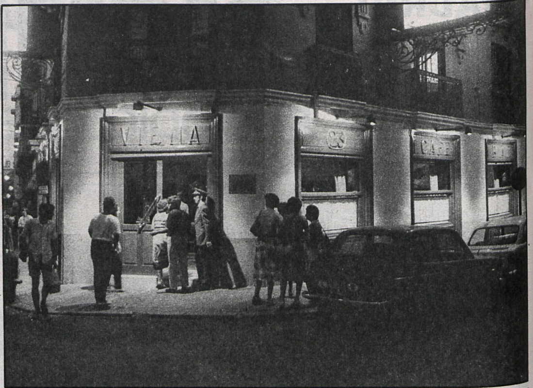
Pocos cafelitos quedan en Madrid, y los que se remozan pasan a ser elegantes cafe-restaurante, como el delicioso Café de Viena

Pese a ser totalmente un cine blanco, blanquísimo, «Finalmente héroe», se deja ver y tiene cierto interés, tanto para la gente menuda, como para los que buscan entretenimiento y evasión; se proyecta en el Cristal, Tivoli y Valle Inclán. Lo anterior apuntado es válido para «El corcel negro», con el aditamento de unos bellos paisajes y una gran interpretación, ¡la del caballo! La verán en el California y Palace. Y como no todo va a ser cine in-