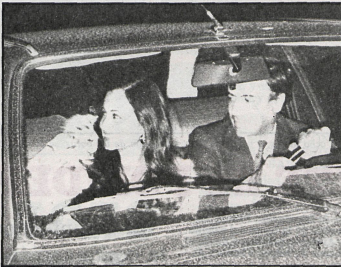
El marqués de Griñón nos ha cantado su verdad sobre las tierras del Rincón. En la foto, en compañía de Isabel Preysler, cuando las revistas del corazón les calificaban de «novios del año»

a preguntar por las condiciones como presuntos compradores y posteriormente, cuando se ha constituido la Comunidad de Regantes entre los propietarios actuales de las diversas fincas.