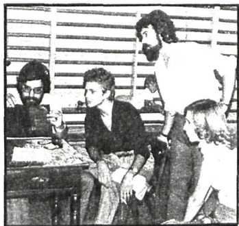
Los preparativos se apresuran ante la inminencia del estreno

Texto: Francisco José CASTILLO HERVAS