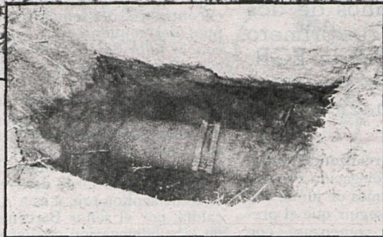
La reparcelación y construcción en fincas sin la adecuada infraestructura puede provocar, según los técnicos, infecciones de todo tipo