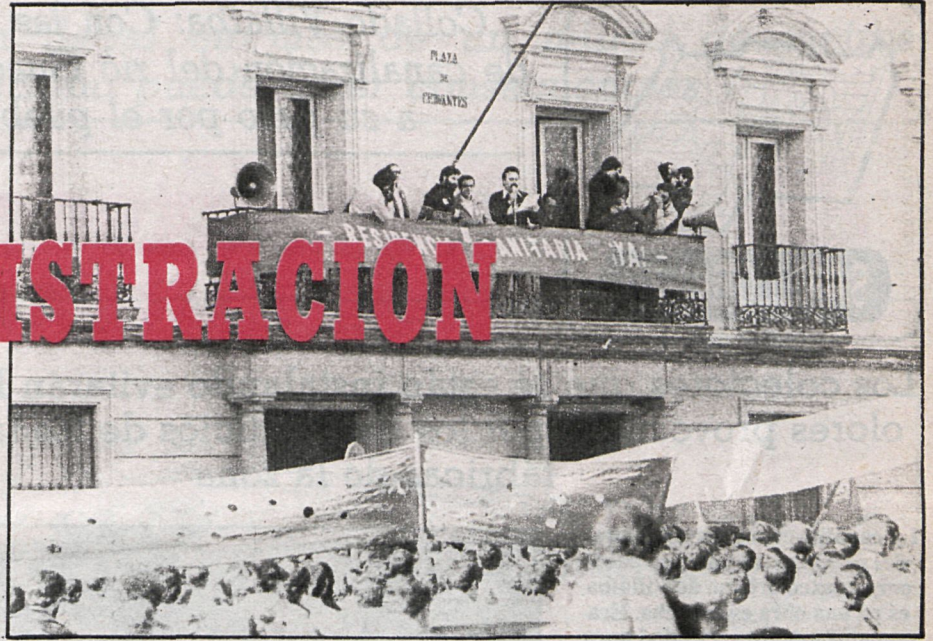
Los problemas sanitarios han sido casi desde siempre una reivindicación de los alcalaínos

Según Antonio Cantó, vocal de la comisión de Urbanismo, «han presionado para la aprobación de un trámite que es innecesario e inútil»