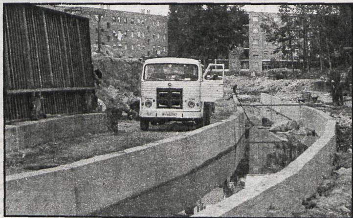
Este es el estado actual de las obras que se llevan a cabo en Collado Villalba