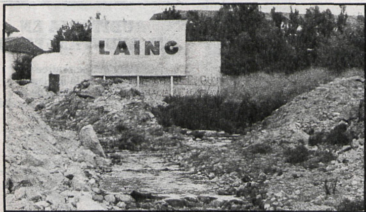
Ya existe el proyecto para la instalación, en un futuro próximo, de una depuradora en la zona

Torrelodones: El casino no podrá inaugurarse en la fecha prevista