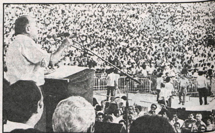
Santiago Carrillo hizo ante los asistentes un profundo análisis de la situación política nacional e internacional

Respecto a la situación interna del país, centró su análisis en los dos problemas más importantes que a su juicio tenemos planteados los españoles: la crisis económica y el paro galopante que ésta genera y la construcción del Es-