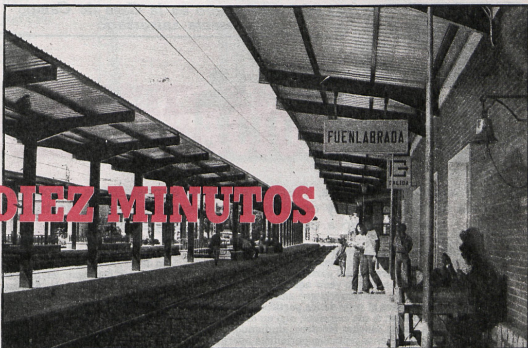
Los trenes aparecerán más asiduamente que ahora por la estación de Fuenlabrada

A finales de octubre, Renfe completará la segunda fase del plan de cercanías para la zona suroeste de Madrid