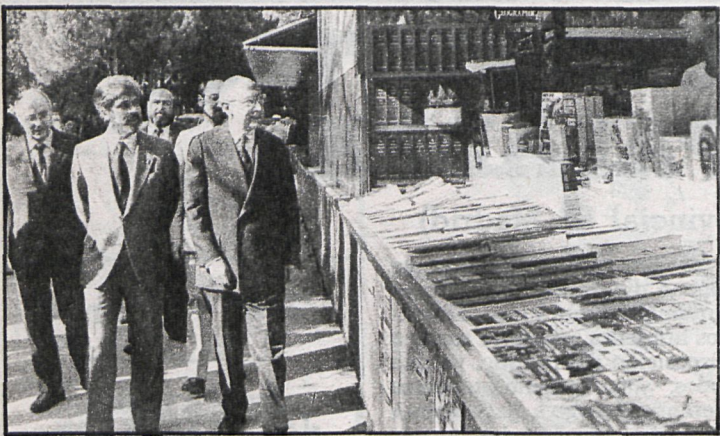
LA DIPUTACION EN LA FERIA DEL LIBRO. — El presidente de la Diputación de Madrid, Carlos Revilla, y el alcalde, Tierno Galván, inauguraron la Segunda Feria del Libro de Otoño en el Retiro madrileño, registrándose una extraordinaria acogida a la caseta montada por la Diputación Provincial, en la que se exponen las publicaciones del Servicio de Extensión Cultural y se difunde el periódico CISNEROS, que los visitantes de la Feria ya conocen por su presencia en los puntos de venta de la provincia.