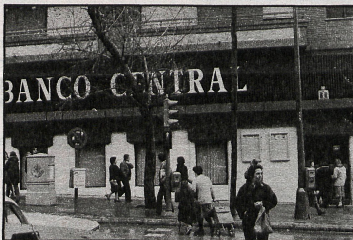
Los bancos serán los menos «tocados» por la crisis económica, y los pequeños y medianos comerciantes los que llevarán sobre sus espaldas, junto con los trabajadores, la oscura trayectoria del 81

Los trabajadores estarían de enhorabuena si la amenaza que pesa sobre muchos sectores de expedientes de crisis y cierres de empresas se diluyese.