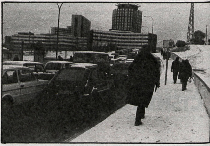
Ni autobuses ni vehículos privados se movieron: la nevada sólo permitió caminar

Las carreteras —competencia del Ministerio de Obras Públicas y Urbanismo— no fueron debidamente «atendidas» para retirar la nieve