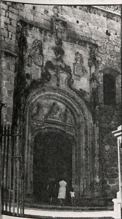
Iglesia de Colmenar Viejo