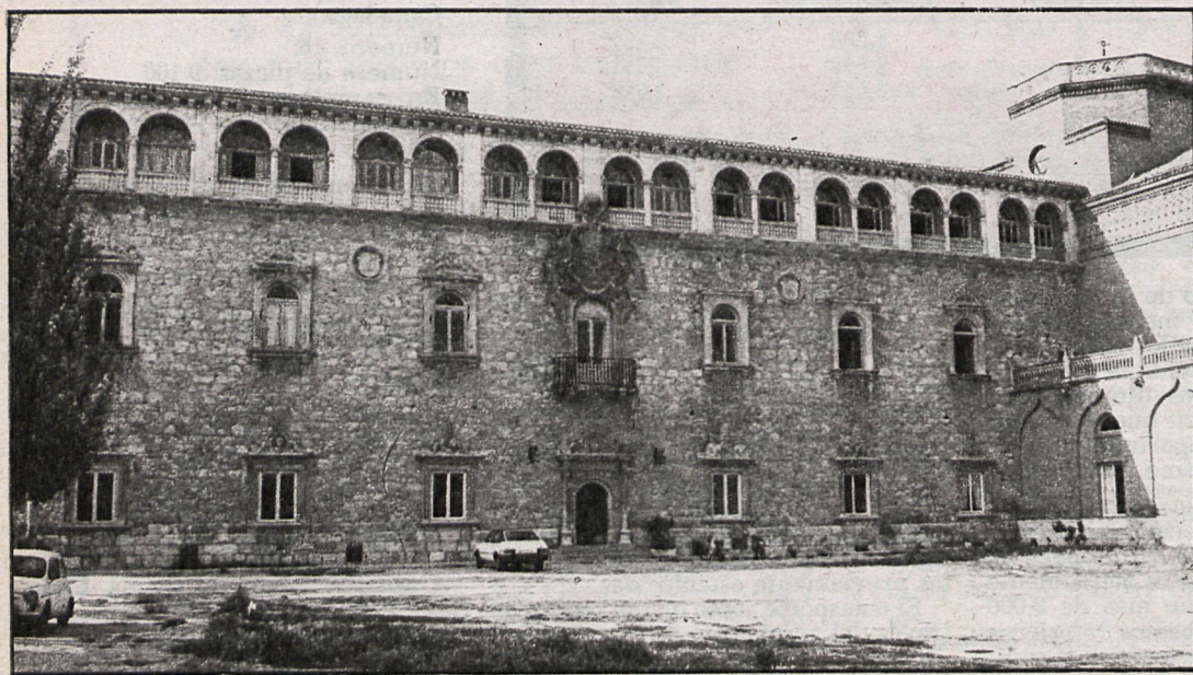
Palacio arzobispal de Alcalá de Henares

—Con esta apoyatura legal, y desde la perspectiva de la máxima racionalidad política, es necesario organizar durante 1981, en nuestra Diputación, el servicio de turismo, que ejecute y coordine las actividades puntuales de la Diputación en el sector turístico, que elabore las bases de un plan provincial turístico y que permita la creación del nivel organizativo y técnico para negociar, en su momento, con la Administración central.