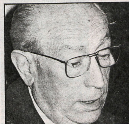
Enrique Tierno Galván, alcalde de Madrid y presidente de IFEMA

cido ingentes beneficios en las economías turísticas de otros países, donde se valora el interior incluso más que las costas, ya que en dichas zonas se practica el turismo de «calidad» y el permanente, no sólo el de temporada, como ocurre en la periferia. En Madrid, en la provincia, tenemos que lograr que los fines de semana los madrileños se desplacen para conocer lugares nuevos, que habrán de conservarse oportunamente para que el deterioro que ya se ha producido en algunas zonas de la provincia no continúe. En el