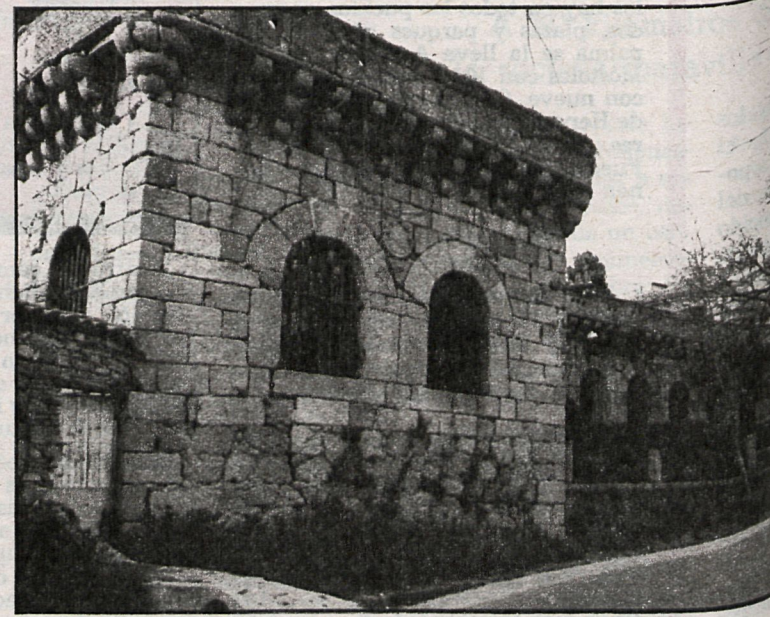
Cadalso de los Vidrios