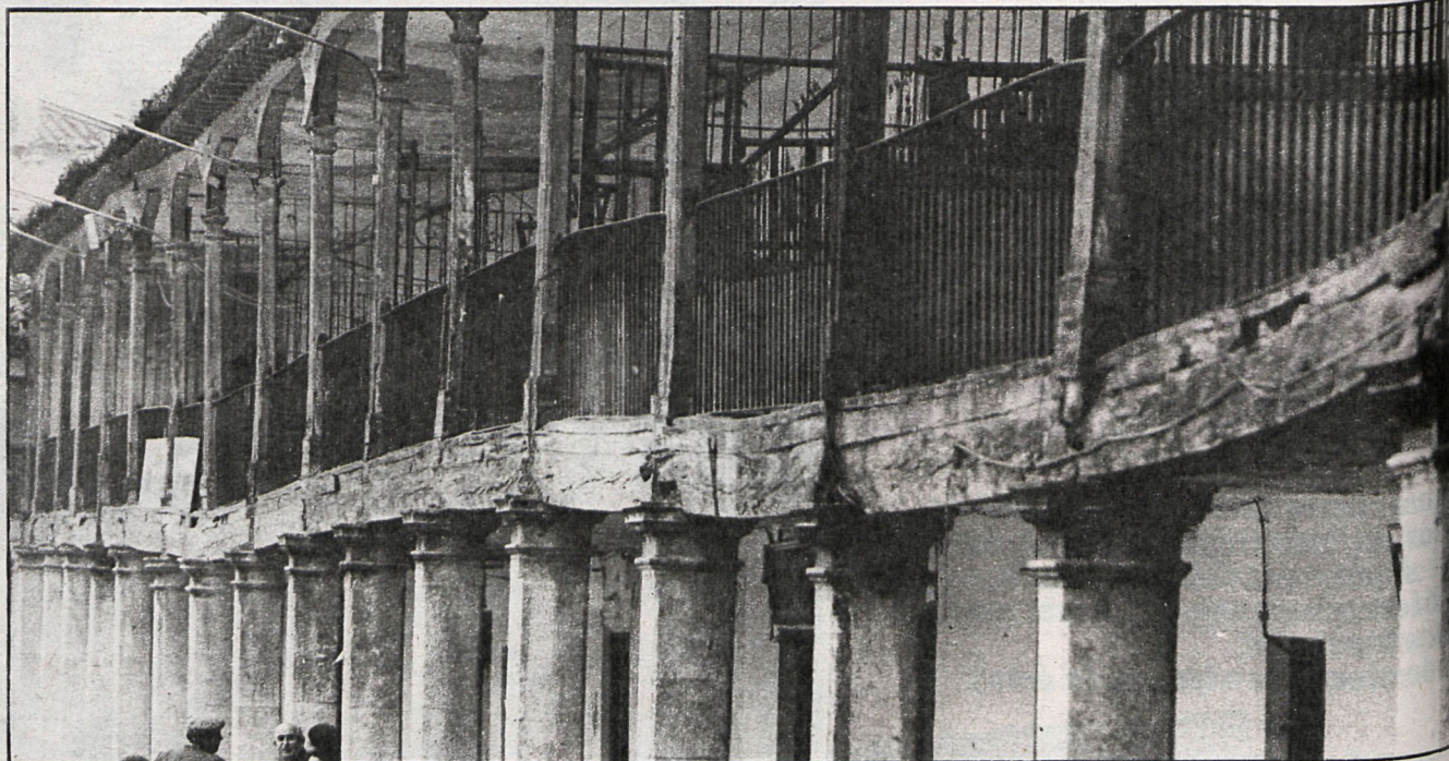
Colmenar de Oreja, plaza Mayor

Hay poblaciones de «cinco estrellas»; pero los lugares menos conocidos suelen guardar vestigios arqueológicos o monumentos que pocos madrileños conocen