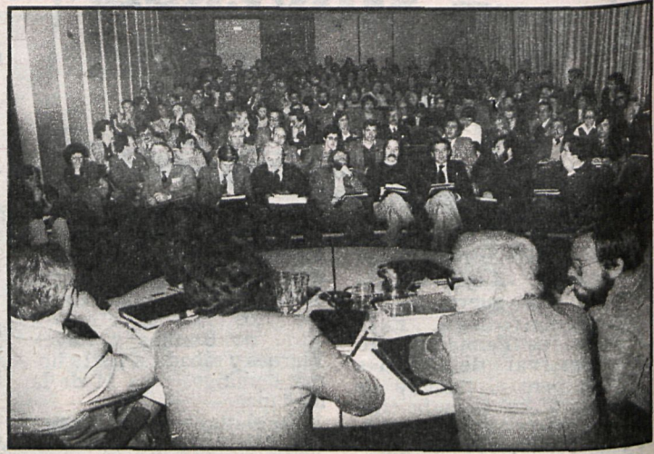
La asistencia a todas las sesiones de las Jornadas de Urbanismo fue masiva y hasta cierto punto sorprendente para los miembros del equipo del Consejo de Municipios, que organizaron las Jornadas