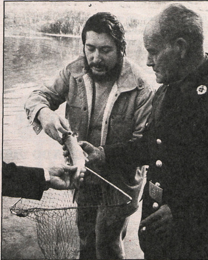
La operación de rescate de más de cien mil peces contó con la participación de organismos como Icoña y expertos en la materia

Las jefaturas provinciales del Icoña de Madrid-Toledo, reclamando vehículos de Alicante y Avila, han podido realizar la penosa tarea de capturar las casi doce toneladas de barbos, para soltarlos aguas arriba de Aranjuez para su supervivencia y regeneración. El muestreo «in situ» de oxígeno daba 0,08 mg/litro en la recepción piscícola y 10,2 mg/litro