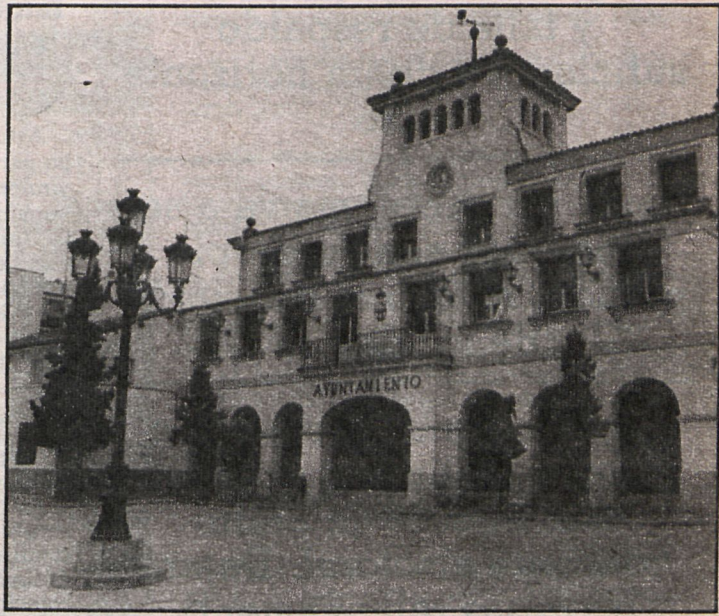
El Ayuntamiento quiere equipar el volumen de los impuestos recaudados con el coste de los servicios prestados

En este sentido se acordó dividir a los establecimientos de hostelería en cinco categorías y cobrar un 5 por 100 de la venta estimada a los establecimientos de primera categoría, reduciendo progresivamente la tasa hasta un 1 por 100 para los de quinta categoría. El impuesto sobre el incremento del valor de los terrenos ha sufrido una modificación similar, estableciéndose unas subidas que giran entre un 5 y un 15 por 100, según las distintas categorías. La publicidad en vallas ha sido la más afectada, con un incremento de un 50 por 100, aunque la ley autoriza una subida de hasta un 100 por 100. Los terrenos sin vallas pagarán ahora 1.500 pesetas por cada metro lineal, mientras que antes pagaban 1.000. Con esta medida se pretende obligar indirectamente a que los propietarios de los solares los rodeen con vallas y dejen de ser lugares donde se arrojen basuras. Este tipo de vallado no paga impuestos. La recogida de basuras subirá un 10 por 100 para los particulares (1.200 pesetas por familia), y a los industriales y comerciantes les supondrá un incremento aproximado de un 30 por 100, en función también del volumen estimado de basuras que se prevé que arrojarán este año.