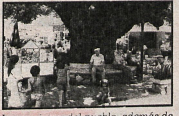
Los ancianos del pueblo, además de la naturaleza, pueden disfrutar de las instalaciones del club municipal

Desde el 21 de noviembre del año pasado Miraflores de la Sierra tiene un Club de Ancianos. Creado por iniciativa municipal, se ha situado en los locales de una vieja escuela de unos sesenta metros cuadrados que han sido habilitados para este nuevo uso. El club se ha fijado como objetivo prioritario dedicarse al esparcimiento y recreo de sus socios, quienes han elegido a su Junta directiva y programan sus actividades. Este club ha contado con una gran aceptación entre los ancianos de Miraflores. Prueba de ello es que al poco tiempo de inaugurarse contaba con 80 socios y actualmente ronda ya los 150. Los socios decidieron pagar una cuota de 100 pesetas al mes, dejando, no obstante, un margen, de tal forma que aquellos que no puedan pagarla aporten lo que esté al alcance de sus posibilidades. El dinero podría ser invertido íntegramente, en principio, en las actividades que quieran organizar, puesto que los gastos de calefacción, mantenimiento del local y la limpieza del mismo corren a cargo del Ayuntamiento.