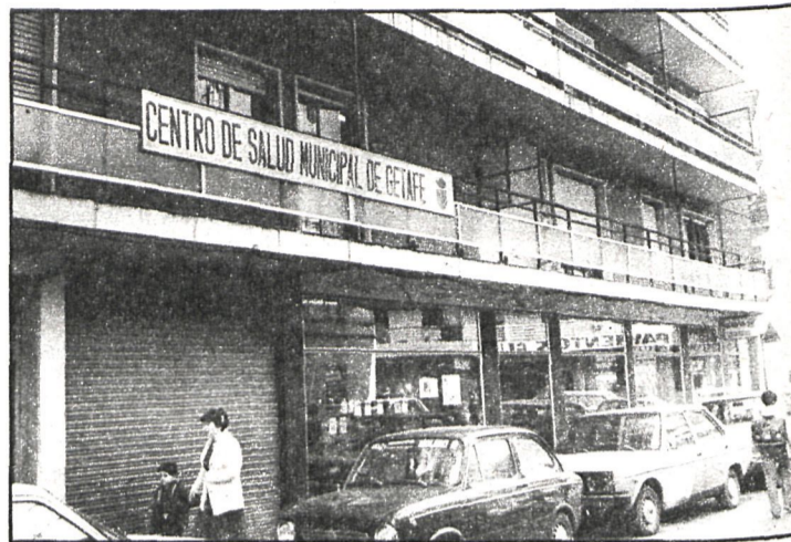
Los centros de salud municipales han venido a paliar las deficiencias existentes en el terreno sanitario

garitas es necesario poner otro consultorio para cubrir la población que vive allí y que ahora tiene que desplazarse. Y después tenemos la promesa, por parte de las autoridades sanitarias provinciales dependientes de la Administración Central, de construir un ambulatorio, en una primera fase, y un centro