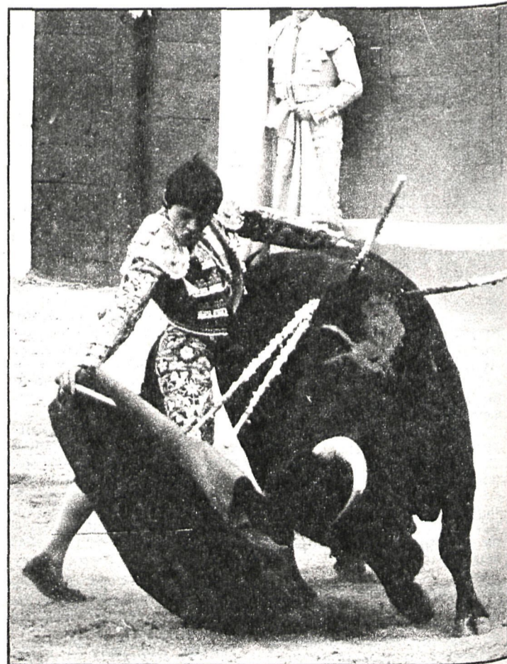
La fiesta será de nuevo protagonista

—Este año estoy dispuesto a repetir la experiencia, aunque hay algunos en este Ayuntamiento reacios a ello. Pero soy optimista y creo que el Ayuntamiento volverá a dar toros. Es más, creo que todos los ayuntamientos de la provincia deberían hacerlo, pues el empresario ha perjudicado mucho