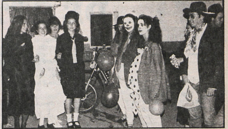
Desde el día 27 las máscaras y disfraces serán un espectáculo normal en numerosas calles de Madrid

Del 27 de febrero al 4 de marzo Madrid celebra sus carnavales. Esta fiesta de carácter popular se vio interrumpida durante muchos años, pero gracias a la iniciativa de los vecinos y al apoyo del Ayuntamiento de Madrid se va a rescatar esta celebración