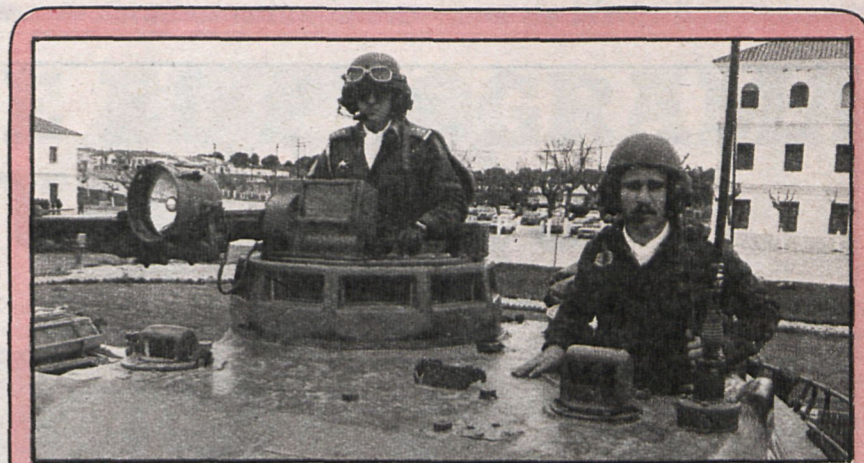
La élite del Ejército español, prácticamente concentrada en la provincia

—Por último, ¿representan un volumen importante los sec-