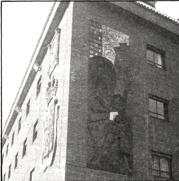
La Casa Consistorial, uno de los puntos afectados si se llevara a cabo el corte de fluido eléctrico

el tema, lo que no estimó la Delegación, por lo cual están obligadas a hacer dicha declaración y satisfacer las ordenanzas municipales vigentes.