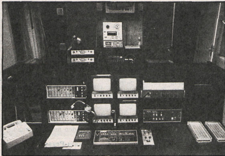
El video para el futuro

Por lo que respecta al super-8 pasa otro tanto. Muchas familias compraron, sobre todo durante el «boom» de lo erótico, cámaras de super-8. Pero cuando pasó la euforia y el dinero, las películas quedaron en las latas. Y aunque los precios no pasan de mil quinientas pesetas por alquiler, no