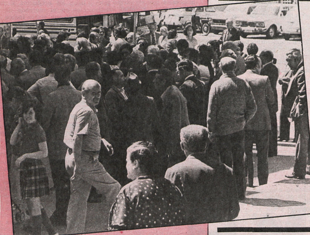
Los censos sirven, entre otras cosas, para ejercer el derecho al voto con ocasión de los comicios que se organizan periódicamente en las sociedades democráticas