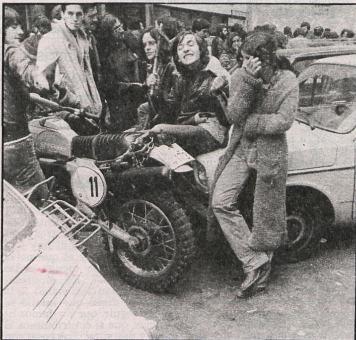
La calle ya no es el único punto de reunión para la juventud vallecana