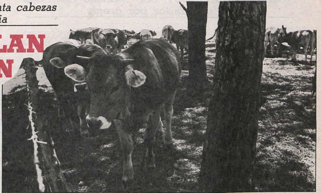
El acto celebrado en Avila es continuación de otras acciones de la Diputación para promover la ganadería en la provincia y tendrá continuidad dentro de un mes con nuevas entregas de reses avileñas