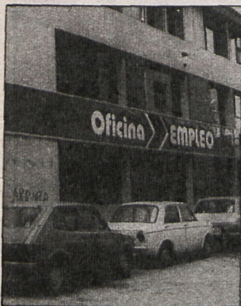
El paro sigue siendo, a juicio del alto ejecutivo del Banco Popular Español, el primer problema de la economía

producto interior bruto, insuficiente no sólo para crear puestos para las nuevas generaciones que acceden al mercado del trabajo, sino también para mantener los existentes. Los empresarios padecen el crecimiento de su «stock» y la baja de la demanda de los bienes o servicios que ofrecen, el aumento de los costes de las materias primas y de la energía que utilizan y el de la financiación que necesitan, les asfixian