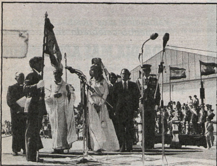
El teniente coronel jefe de las FAMET se dirige a los asistentes al acto tras recibir la enseña nacional

El presidente, Rodríguez Colorado, hizo entrega del estandarte, que refuerza las tradicionales buenas relaciones entre la corporación provincial y los Ejércitos de España