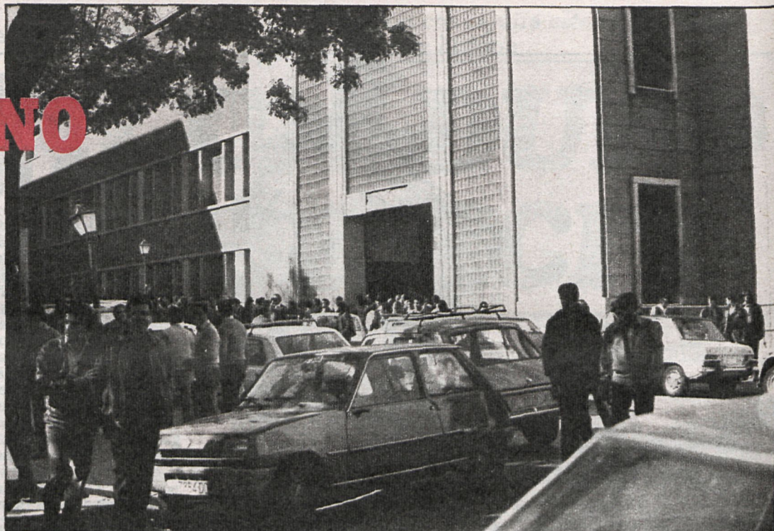
Uno de los principales objetivos del acuerdo es mantener y multiplicar, si es posible, los puestos de trabajo

económica española. La propia OIT (Organización Internacional del Trabajo) se ha interesado por los términos del acuerdo, y, en general, todos los agentes internacionales —en estos momentos claves para la salida de la crisis— han visto, junto con los españoles, el acuerdo como el inicio de la esperanza en el futuro de la economía española.