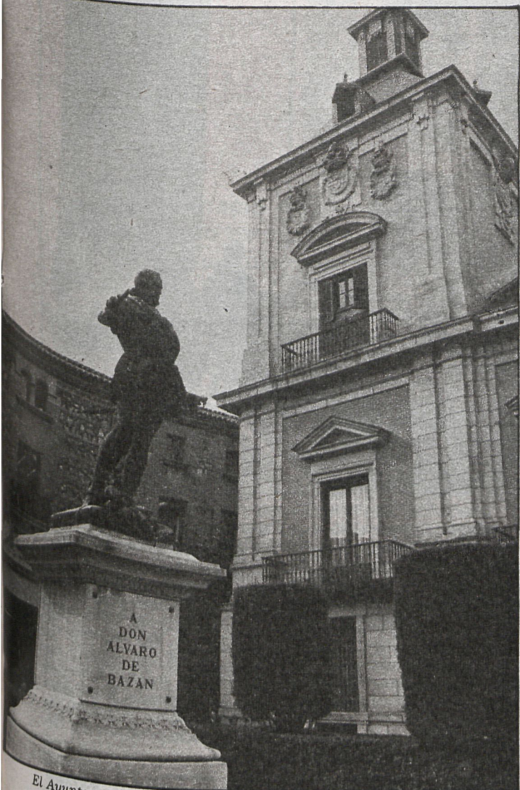
El Ayuntamiento madrileño conseguirá el milagro de no tener un duro de déficit por primera vez en su historia