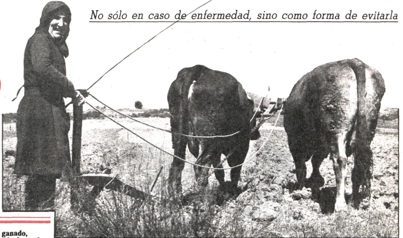
No sólo en caso de enfermedad, sino como forma de evitarla