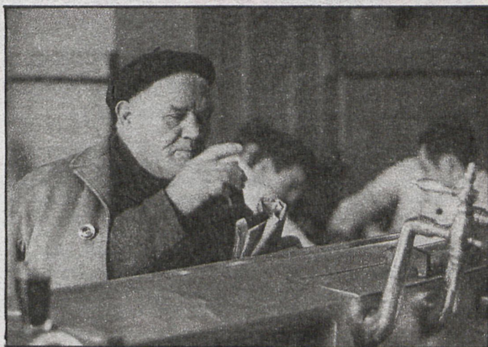
La tercera edad tiene problemas para reunirse en Argüelles, como en muchos otros lugares de Madrid y provincia