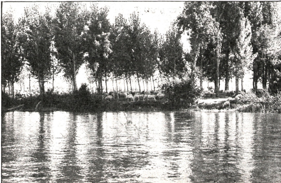
El lavado de ganado debe realizarse para enfermedades, pero también para evitarlas