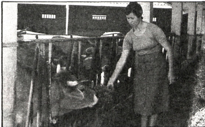
Los ganaderos deben aprender que la costumbre de lavar el ganado no es meramente atávica, sino que se inspira en principios científicos