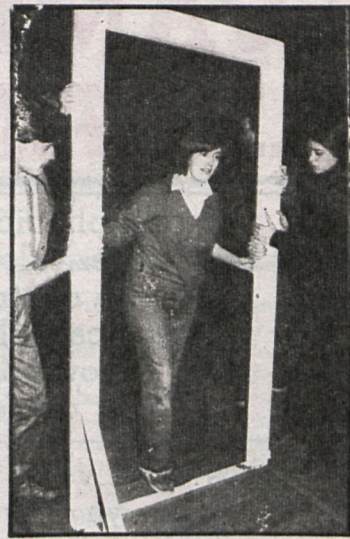
La cooperativa de carpintería es una de las que forman parte de esta primera experiencia, que tiene como protagonistas a los jóvenes

Gracias al apoyo económico y al asesoramiento técnico y ayuda en la comercialización de los productos se piensa que la idea podría cuajar y autofinanciarse. De todas formas, hasta una vez concluido el periodo de aprendizaje no se empezará a funcionar en serio,