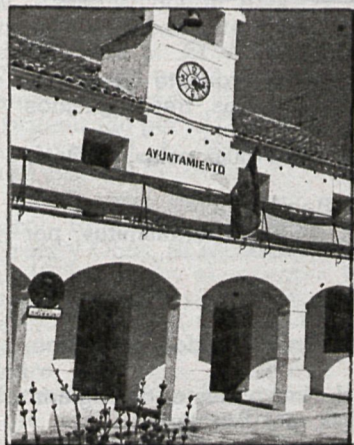
La Corporación de Parla ha aprobado la construcción del estadio para su equipo local