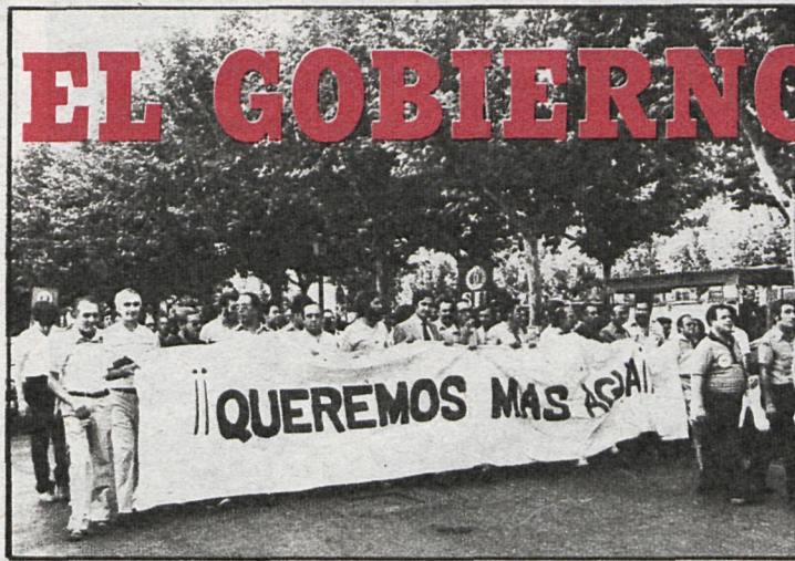
Las protestas de los alcalaínos parece que están cayendo en saco roto

Los vecinos y el Ayuntamiento de Alcalá de Henares continúan los actos de presión para que la Administración Central agilice todo lo posible las obras que solucionarán definitivamente el problema del agua de la ciudad