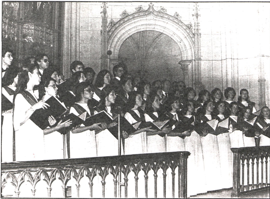
Varios grupos corales actuarán hasta el día 30 en el Real Coliseo Carlos III

La intervención de la Fuerza Pública impidió a Fuerza Nueva celebrar los actos que tenía previstos para el día 19 en San Lorenzo de El Escorial. Miembros de la Guardia Civil impidieron la entrada al pueblo a Blas Piñar y a todo aquel que no demostrase su residencia habitual en el pueblo. Por la tarde, Fuerza Nueva celebró una misa en el Valle de los Caídos.