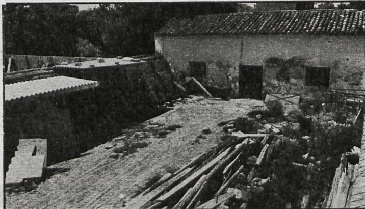
El matadero se encontraba en un estado ruinoso y casi parece mentira que fuera un matadero

El edificio, por otra parte, está prácticamente en ruinas. En el Ayuntamiento no hay constancia de cuando se construyó. Ahora será derribado y en su solar se levantará un nuevo edificio destinado a centro para la tercera edad y