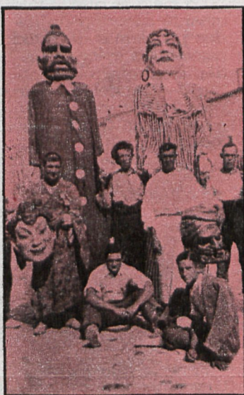
A los cabezudos también les ha llegado el cambio, aunque todavía viven. Sin embargo, empiezan a pegar con fuerza los muñecos movidos con varillas

entonces se le venera como el Cristo Aparecido.