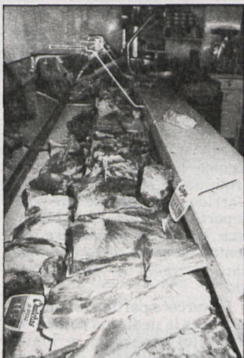
A los nuevos inspectores de mercados se les exigirá una alta preparación, de forma que ejerzan un control estricto y rápido de la calidad de los productos

vehículos cuyos conductores vendían directamente tres canales de vacuno (unos setecientos kilos de carne) y lechugas (75 cajas).