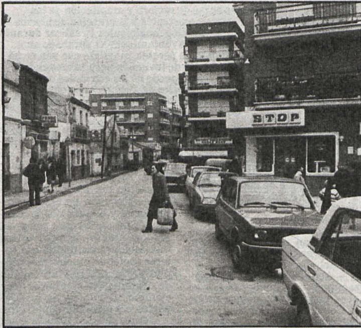
Mediante el acuerdo al que se ha llegado ahora entre el Canal de Isabel II y el Ayuntamiento, aquél se hará cargo del suministro de agua del casco antiguo

Los trabajos de renovación de la red de abastecimiento de agua en el casco antiguo de Al-