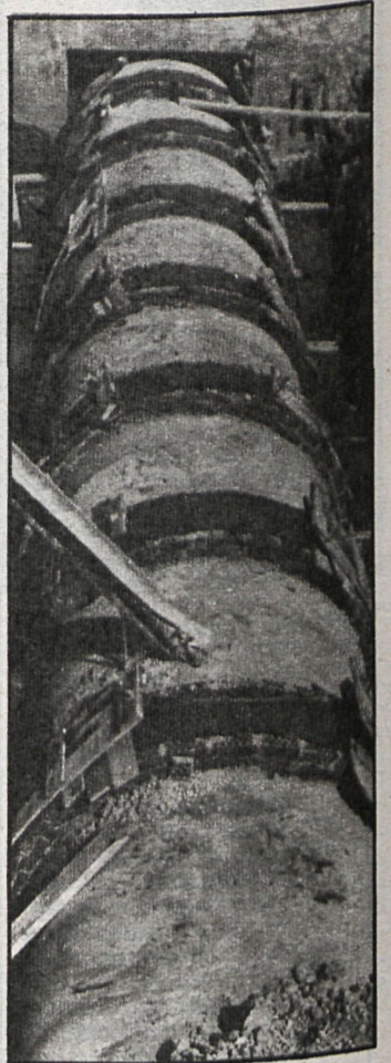
El Ayuntamiento ha tenido que pedir un crédito de 139 millones para ejecutar las obras de renovación del alcantarillado

red, que en muchas zonas está en condiciones lamentables; y por otra, de separar esta red de la red de alcantarillado, por donde discurren los vertidos de aguas residuales, con los consiguientes peligros de contaminación. Es un hecho que en la mayor parte de las localidades de la periferia sur ambas redes discurren paralelamente. Una solución a los problemas