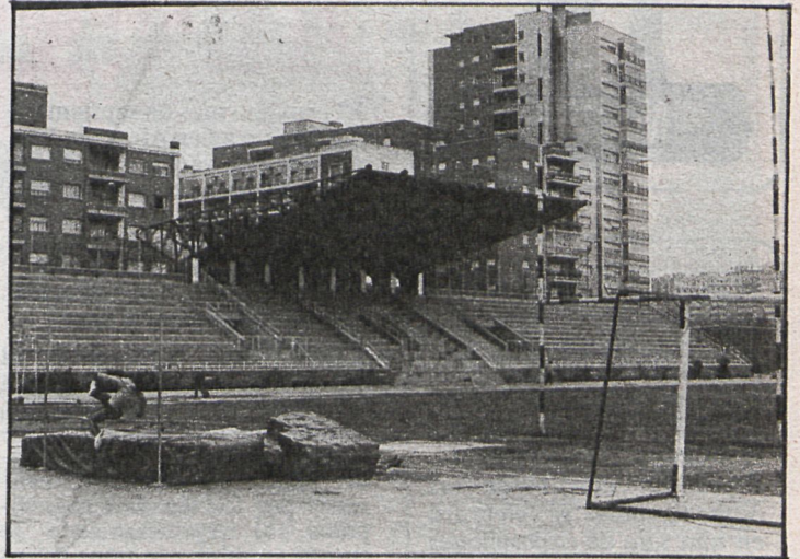
El estadio de Vallehermoso es uno de los motivos de litigio entre el Consejo Superior de Deportes y el Ayuntamiento. Este último desea que pase a su poder

Pero aún faltan unos dos o tres meses para que el estudio del Consejo esté terminado, según las propias estimaciones del gerente.»