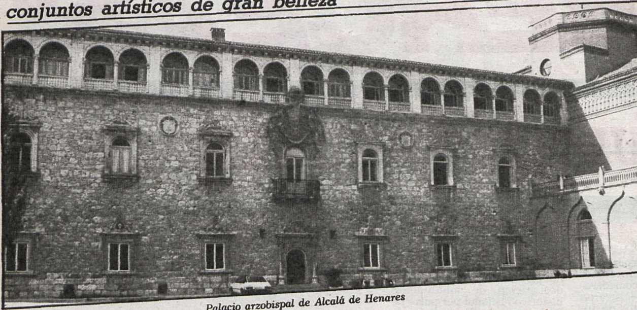
Palacio arzobispal de Alcalá de Henares

Los organismos turísticos privados no incluyen en sus rutas conjuntos artísticos de gran belleza