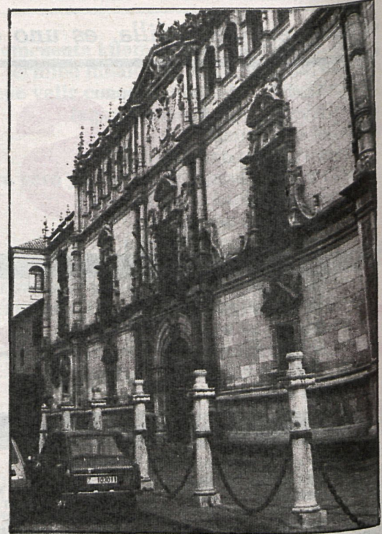
La fachada de la Universidad de Alcalá es una buena muestra de los tesoros artísticos de esta ciudad

Este reportaje sobre la monumentalidad de la provincia de Madrid, que casi se ha convertido en inventario, tiene su base en el desconocimiento que parece existir entre los organismos a nivel privado que mueven los grandes contingentes del turismo nacional e internacional sobre los valores positivos, aunque algunos estén en estado ruinoso, que encierran nuestros pueblos