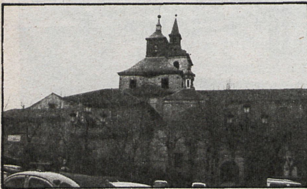
Iglesia de Arganda del Rey

y arcos de medio punto: el gran teatro del XVIII. La casa del XVIII de la calle Abastos: el cuartel de Reales Guardias Walonas. Y la casa donde mu-