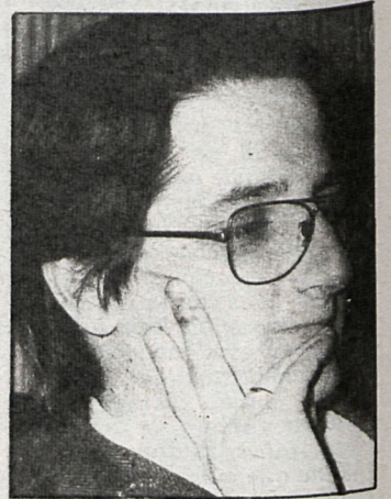
La Corporación que preside Manuel de la Rocha ha optado por aplicar todo el peso de la ley al policía municipal que se extralimitaba en sus funciones

UCD apoyase la posición de la izquierda (que suma en total 13 votos: ocho del PSOE, cuatro del PCE y uno del PTE).