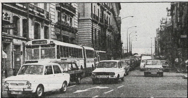
El polémico tema de la financiación de los transportes salta nuevamente a la palestra