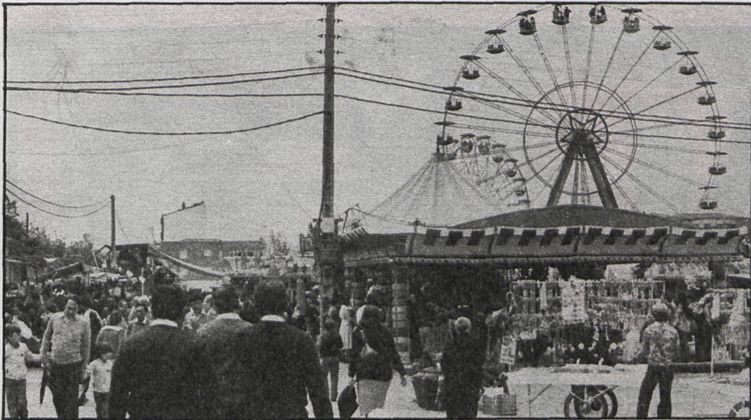
Las fiestas de Fuentidueña, aparte de las diversiones habituales, contaron con la tradicional procesión de la Virgen de la Alharilla, una Virgen «marinera»

Todos estos descubrimientos han impulsado al Ayuntamiento a pensar en la posibilidad de montar un museo de arqueología e historia en el municipio, financiado por las arcas municipales.