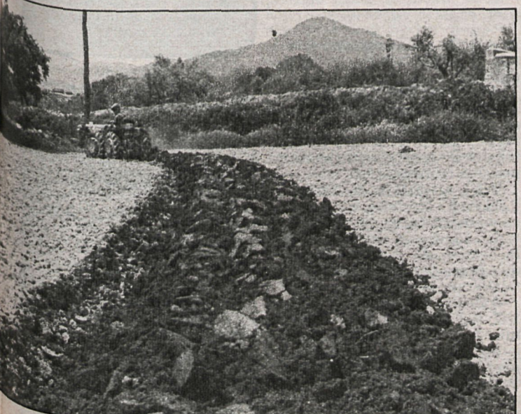
La actividad de los agricultores de cara al año que viene quedará regulada a raíz de las conversaciones actualmente en curso