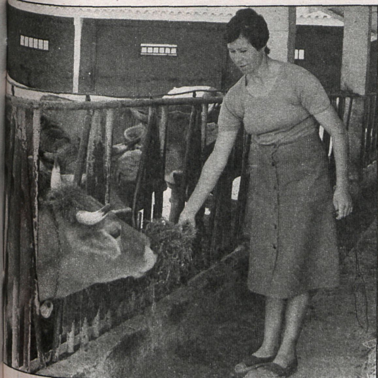
Debido a la sequía, los ganaderos han tenido que alimentar a los animales de forma «artificial», lo que ha provocado un aumento de los gastos

próximas semanas la situación será auténticamente dramática.