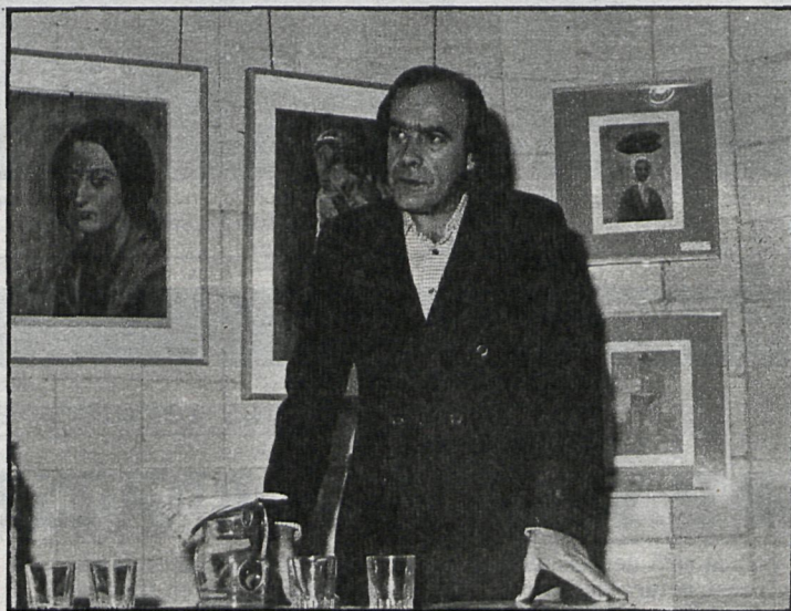
El prestigioso crítico de arte Santiago Amón «traduce», a través de sus conferencias, la obra del gran maestro de la pintura contemporánea

Con motivo del homenaje se ha editado además un periódico, bajo la experta dirección de la Oficina de Medios de Comunicación de la Corporación, bajo el título «Picasso», en el cual el crítico de arte, señor Amón, escribe sobre «El nuevo paisaje». En otro lugar del periódico se recogen «Hitos en la vida del artista», según texto