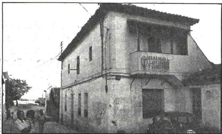
Este es el edificio de la antigua casa consistorial, cuya demolición enfrenta a los concejales de la Corporación

El Ayuntamiento de Villaviciosa de Odón ha recibido de la Diputación Provincial una ayuda de 400.000 pesetas con posibilidades de aumentarla en otras 200.000 del complemento de presupuesto del presente año, y que están destinadas a facilitar la continuidad de las excavaciones arqueológicas que desde hace aproximadamente un año se están realizando en las proximidades del río Guadarrama y que han dado como resultado el descubrimiento de importantes hallazgos.