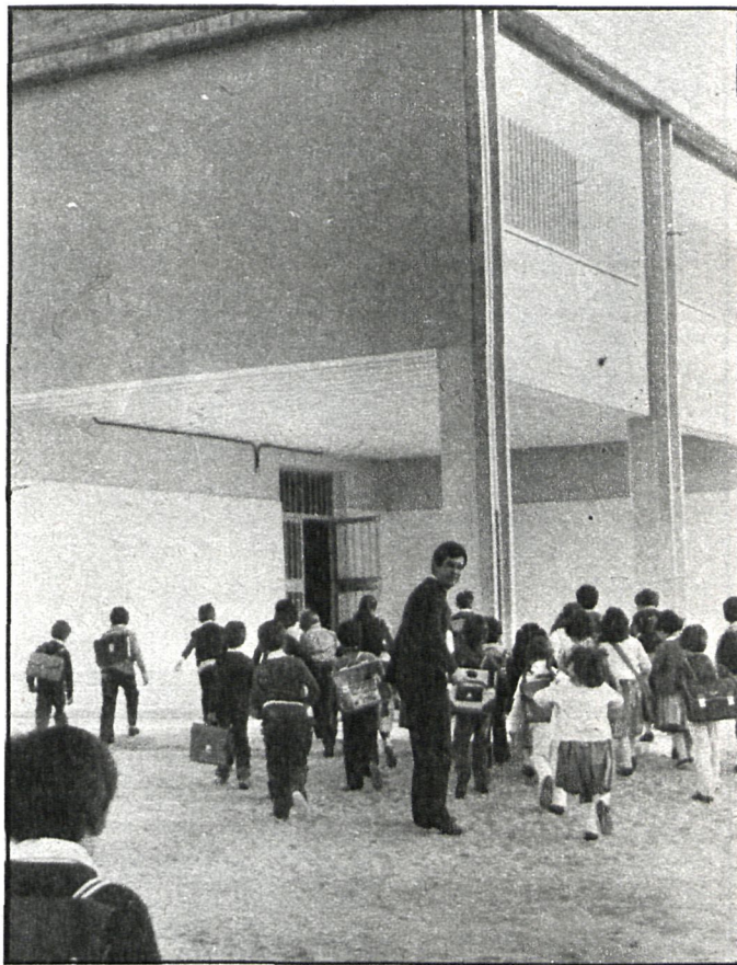
Los niños de Móstoles inauguraron el día previsto el nuevo centro escolar

próximo, pues el colegio aún no está terminado. Faltan por construir otras ocho aulas más y un pabellón con laboratorio y gimnasio y el patio de recreo. A pesar del retraso de más de un mes con que han comenzado las clases, los niños sólo recuperarán quince días, ya que los trabajos organizativos, de administración y compra de libros los tenían totalmente resueltos el día que empezaron las clases. El claustro de profesores había estado trabajando en estrecho contacto con los padres desde otro colegio y estas cuestiones preliminares ya se habían solucionado. La recuperación de esos días de retraso se hará a razón de cinco por trimestre.