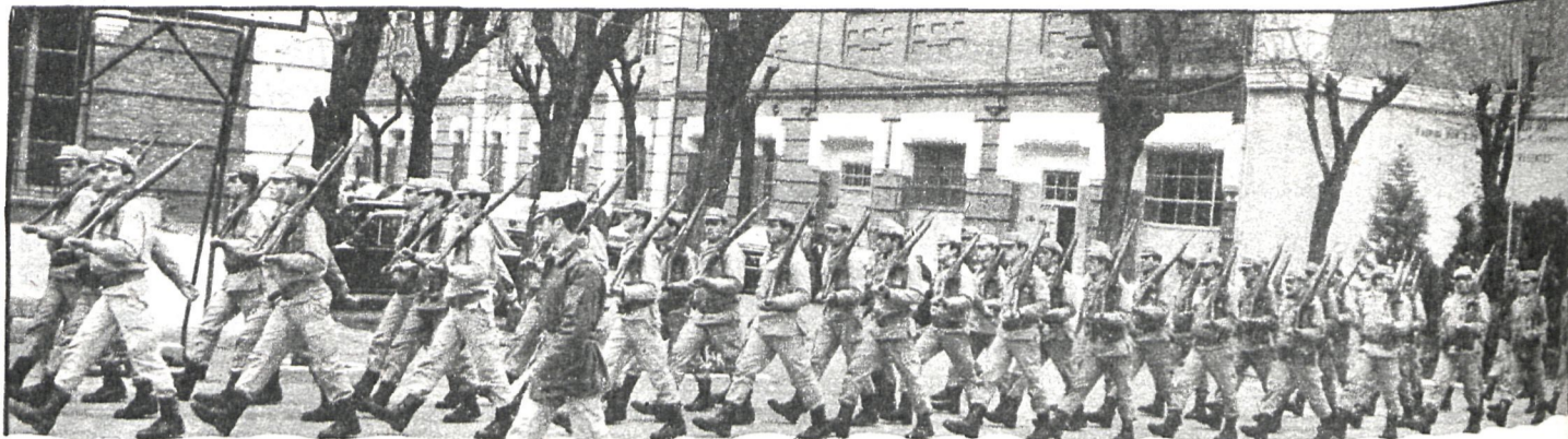
Con el homenaje al regimiento de Artillería, el pueblo de Colmenar del Arroyo ha querido mostrar su cariño hacia el conjunto del Ejército español

Anteriormente la Sagrada Forma se guardó en otras dos custodias que fueron donadas por Carlos II e Isabel II, las cuales fueron robadas durante la invasión francesa y en el verano de 1942, respectivamente.