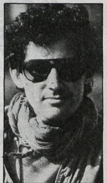
Miguel Ríos prefirió quedarse en casa