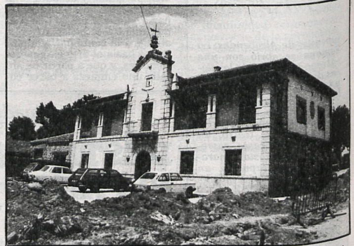
Ayuntamiento de Los Molinos: la adhesión a la autonomía fue aprobada con cuatro votos en contra

En relación con las cuentas de gastos e ingresos de las fiestas de septiembre, celebradas en honor del Santísimo Cristo de la Buena Muerte, y presentadas por la Alcaldía, las cuales fueron aprobadas con los votos de los concejales de UCD y CD, el señor Partida manifestó que «es inadmisibles que unas fiestas sin participación popular por falta de imaginación de los organizadores suponga un coste de 1.000 pesetas por vecino, ya que los gastos ascienden a 2.939.000 pesetas y los ingresos obtenidos a 894.651 pesetas, lo que arroja un déficit de 2.044.349 pesetas».