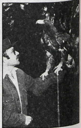
Varios animales como el que vemos en la fotografía —en este caso perteneciente al Aula de la Naturaleza, de la Casa de Campo— han sido robados del minizoo del área de servicio, en Villalba