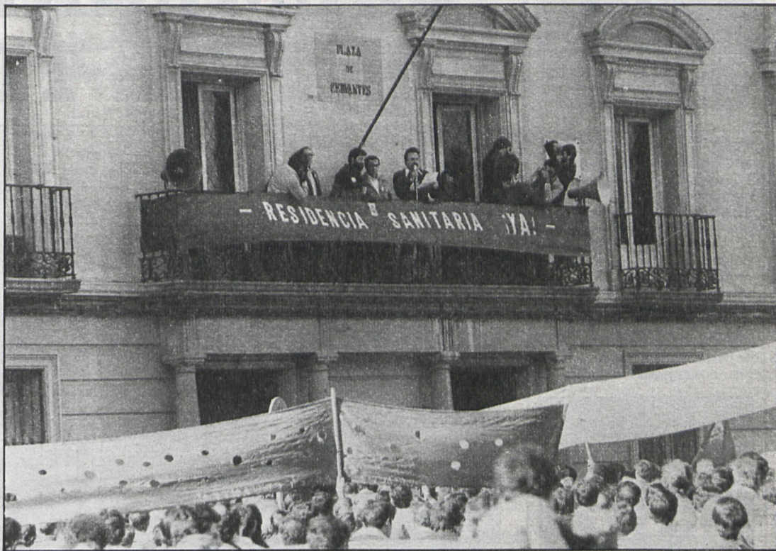
La reivindicación de mejoras en la asistencia sanitaria ha sido una constante para los vecinos de Alcalá. En la foto, una de las concentraciones para pedir la residencia sanitaria, ya en construcción

Del estudio sectorializado se desprenden las siguientes conclusiones: El distrito El Chorrillo, con 32.000 habitantes y unas previsiones de 41.000, tiene un ambulatorio que sólo funciona por la mañana, y, según el estudio, para atender la demanda debería funcionar mañana y tarde. El distrito Carmen Calzado, con 37.000 habitantes, es la zona con la renta «per capita» más alta. El ambulatorio es arcaico en sus instalaciones y se requiere efectuar obras de ampliación y acondicionamiento. La zona de Reyes Católicos es la peor equipada. Existe un ambulatorio que no reúne las condiciones mínimas higiénico-sanitarias por existir humedad al inundarse periódicamente sus instalaciones. El Ayuntamiento