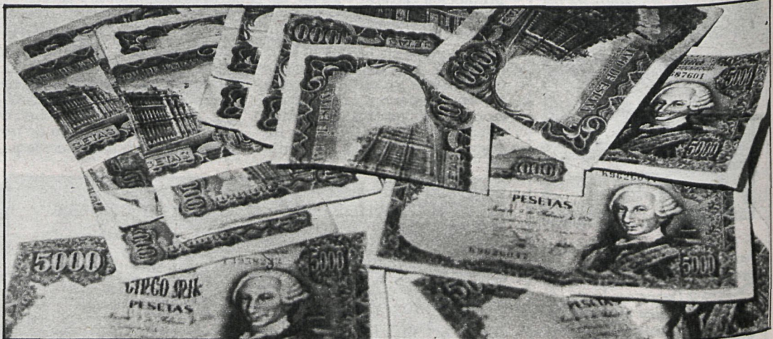
Algunos vecinos de Las Rozas son reacios a aportar su dinero al municipio

Varios vecinos de Galapagar han manifestado a CISNEROS que «no creen que exista ningún peligro, ya que la pequeña grieta apareció hace más de dos años y desde entonces, antes de empezar el año escolar, los técnicos municipales revisan las aulas.