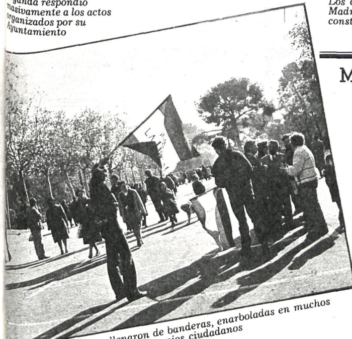
Las calles de Madrid se llenaron de banderas, enarboladas en muchos casos por los propios ciudadanos

ción con unos actos populares encaminados a propagar el espíritu constitucional y a asegurar su continuidad en el tiempo. En Arganda, los actos conmemorativos se celebraron durante toda la semana a través de una serie de conferencias que pusieron de manifiesto la importancia de la fecha para la convivencia en un Estado de derecho. Como culminación, el pasado domingo se celebraron distintos pasacalles y actos de afirmación y acatamiento constitucional por parte de los miembros de la Corporación y Policía Municipal. Actos semejantes se registraron en Villarejo de Salvanés y otros municipios del partido