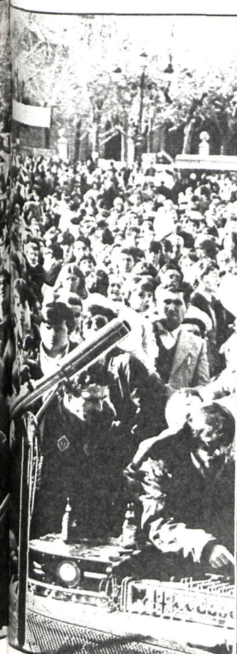
Arganda respondió entusiásticamente a los actos organizados por su Ayuntamiento