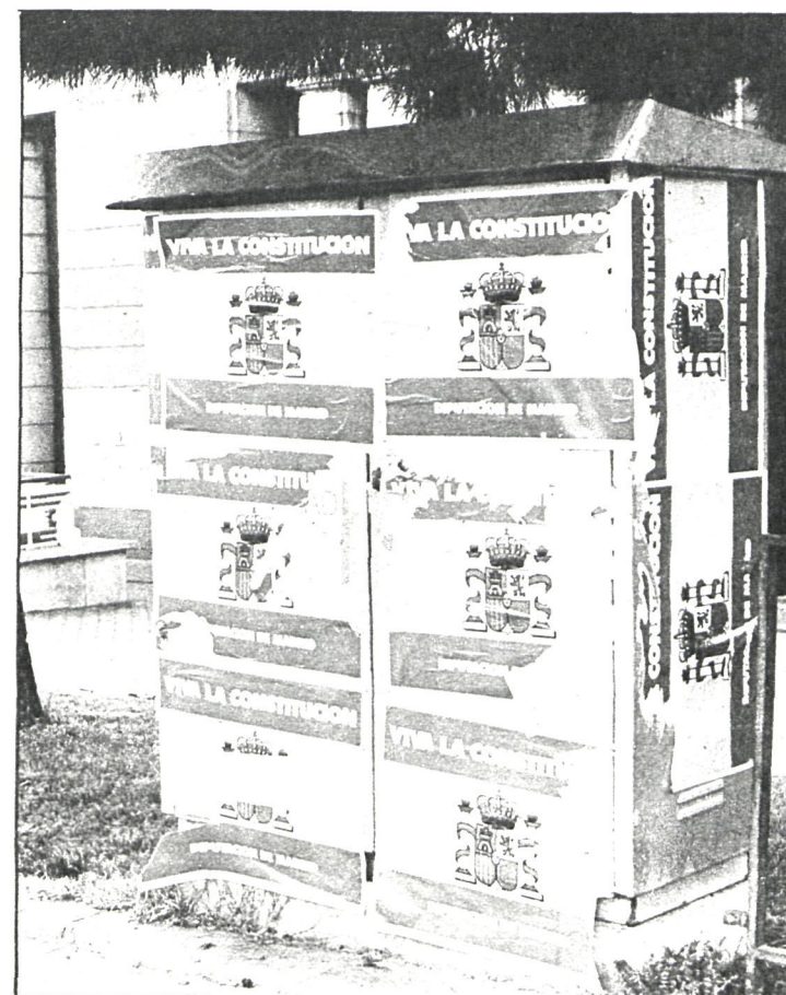
Los carteles editados por la Diputación de Madrid con la bandera de España, el escudo constitucional y la leyenda 'Viva la Constitución!' llenaron las calles

En el «Boletín Oficial del Estado» de 23 de los corrientes se inserta anuncio para contratar, mediante subasta, las obras de refuerzo con aglomerado asfáltico del camino vecinal 117, del kilómetro 10 de la N-III a la de Vicálvaro a Rivas del Jarama. El precio tipo de la subasta es de 7.812.394 pesetas, pudiendo presentarse proposiciones en la sección de Fomento de esta Corporación, paseo de la Castellana, 51, planta 4.ª, edificio de La Caixa, hasta las doce horas del día 17 de diciembre de 1981, previo depósito en concepto de garantía provisional de 147.185 pesetas.