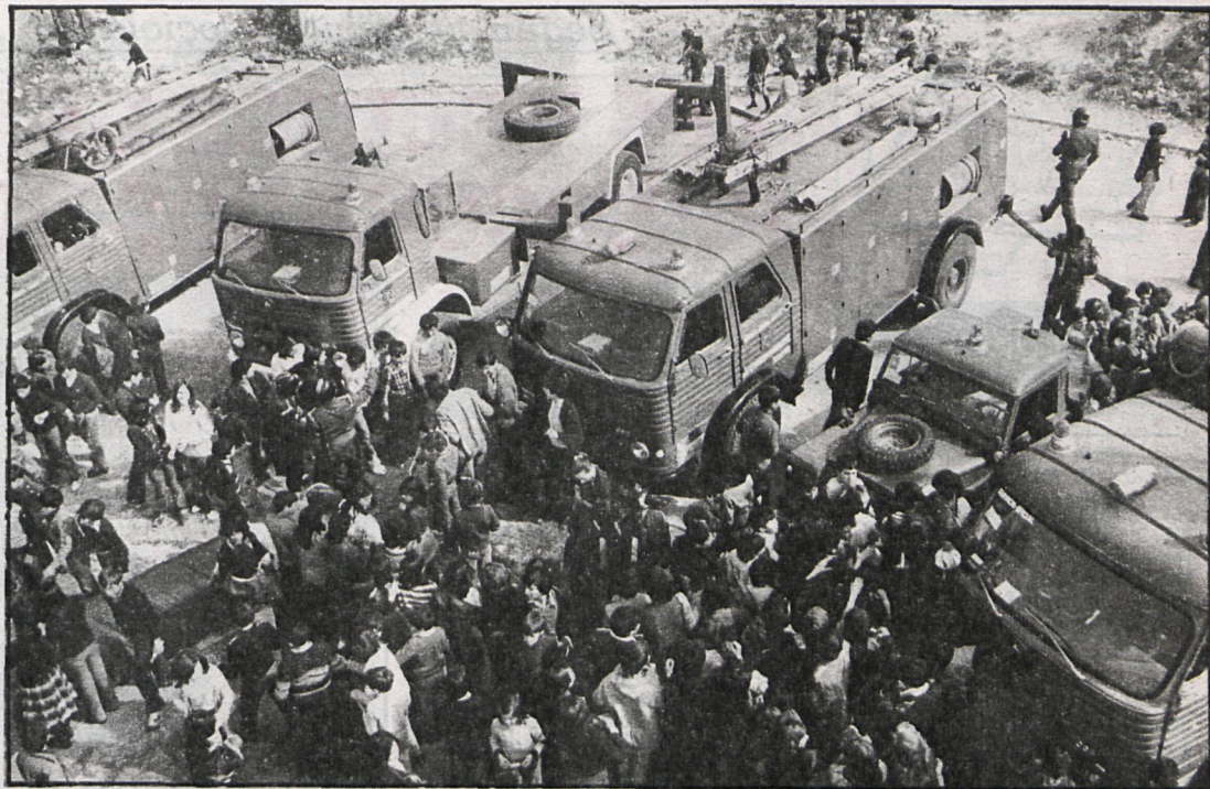
Los bomberos enseñaron a los jóvenes de Leganés la forma de salir de situaciones difíciles

El simulacro de evacuación de personas del colegio nacional Gerardo Diego, de Leganés, por un supuesto incendio, fue el acto central de la jornada de clausura del I Curso Experimental de Seguridad Ciudadana organizado por el