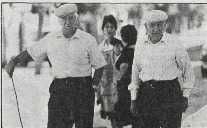
La tercera edad, protagonista de la encuesta realizada por el Ayuntamiento de Majadahonda

Sin embargo, los resultados más interesantes de este estudio están referidos al casco viejo de Majadahonda, que puede