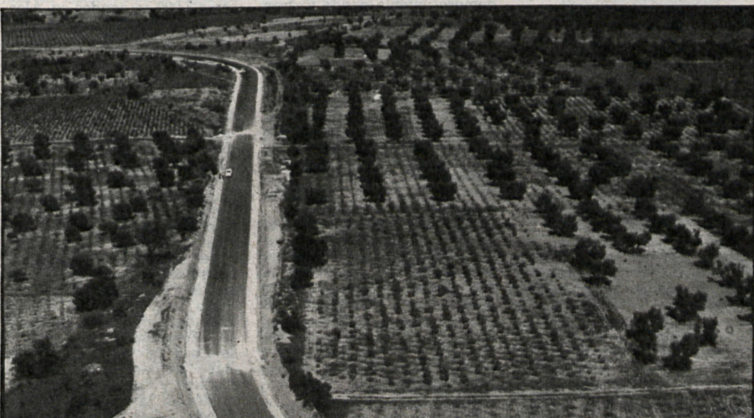
Las vegas necesitan una promoción para equilibrar la zona este de Madrid. Las posibilidades de la agricultura en este área son enormes, pero es necesario sanear los ríos en primer lugar

Un problema grave para el tráfico en la zona son los camiones que cruzan la capital en todos los sentidos, desde el Norte y desde el Sur, por lo que se tendría que habilitar un camino alternativo, con pequeñas carreteras existentes y algún nuevo tramo, para desviar de la N-II este importante volumen de tráfico.