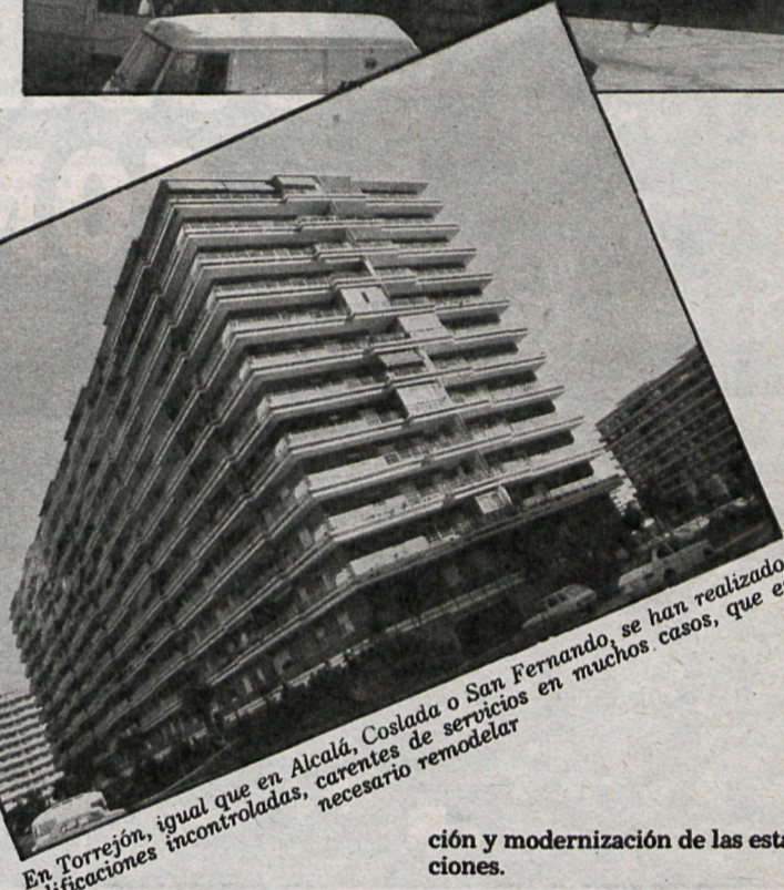
En Torrejón, igual que en Alcalá, Coslada o San Fernando, se han realizado edificaciones incontroladas, carentes de servicios en muchos casos, que es necesario remodelar

en todo el Area Metropolitana, la solución a los problemas heredados pasa por el ferrocarril, con las mejoras de la red previstas en el plan de cercanías de Renfe, entre las que destacan la ampliación a cuatro vías de la red a Chamartín y Atocha, electrifica-