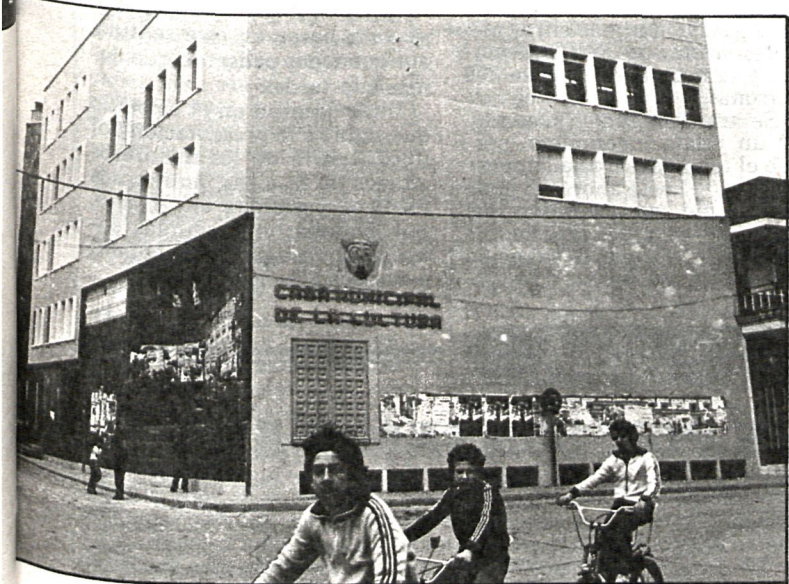
Los equipamientos culturales han ido creciendo a lo largo del año 1981, y los alcaldes manifiestan su deseo de seguir en esa línea durante el año que comienza

Para el año que empieza, los alcaldes esperan consolidar la política de obras públicas, infraestructura, equipamientos culturales y deportivos, además de aumentar los recursos de la Policía Municipal