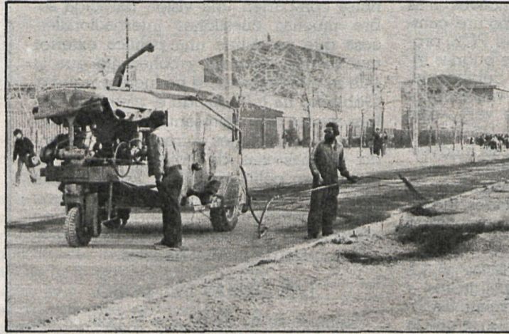
Numerosas calles intransitables, que son norma general en los pueblos españoles, se han ido convirtiendo a la «civilización» con las operaciones de asfalto municipales

una disponibilidad financiera limitada, hay que buscar el equilibrio entre los servicios que se dan y su calidad y las obras que se realizan. Lo más urgente que necesita Pozuelo es mejorar el abastecimiento de agua y su distribución y la construcción del colector general. Las fases segunda y tercera de la red de distribución de agua ya se están haciendo con un crédito de la Caja de Ahorros, y para las fases cuarta y quinta y el colector estamos a la espera de que el Banco de Crédito Local nos conceda un crédito que hemos pedido. El presupuesto es de 423 millones de pesetas, cantidad pequeña para un municipio de 4.200 hectáreas, con una población de 35.000 habitantes y una gran parte del pueblo sin asfaltar, con una iluminación deficiente y una casa consistorial totalmente insuficiente para poder desarrollar el trabajo no