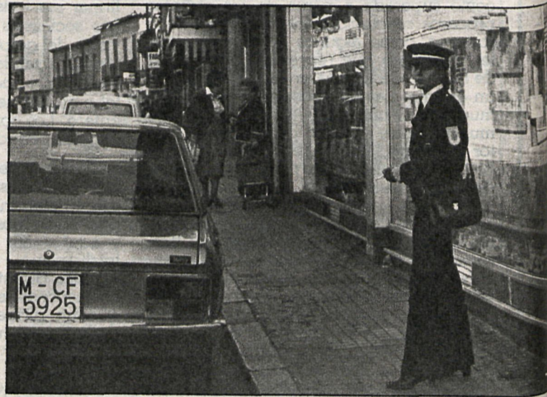
Policías municipales mejor preparados técnica e intelectualmente y con medios para desempeñar su importante labor. Otro de los éxitos que hacen suyos los alcaldes democráticos

La falta de recursos económicos es la «espada de Damocles» que pesa permanentemente sobre los municipios de la provincia