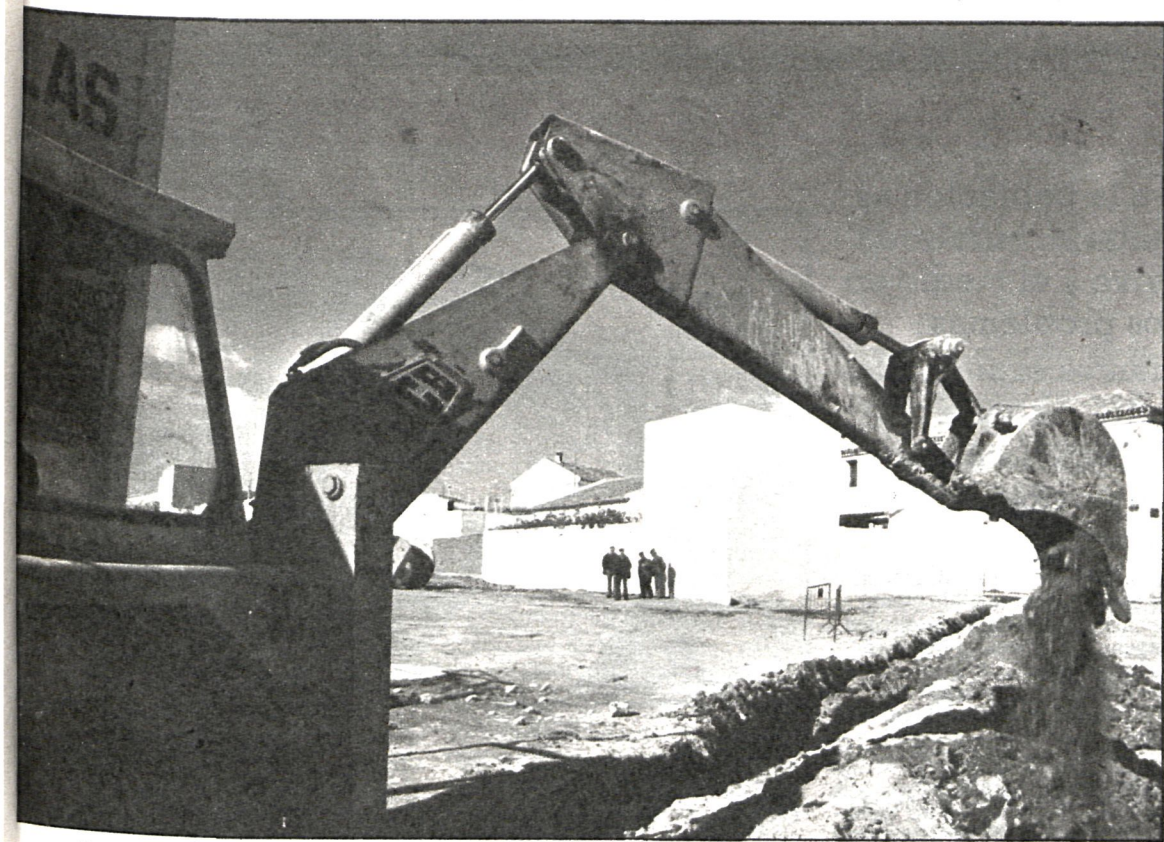
Las obras públicas, fundamentalmente traída de aguas y construcción de depuradoras, han sido el capítulo más importante de gastos de los municipios madrileños

pales, con lo cual los sesenta y cinco trabajadores de la empresa que realizaba este trabajo han sido absorbidos por el Ayuntamiento.