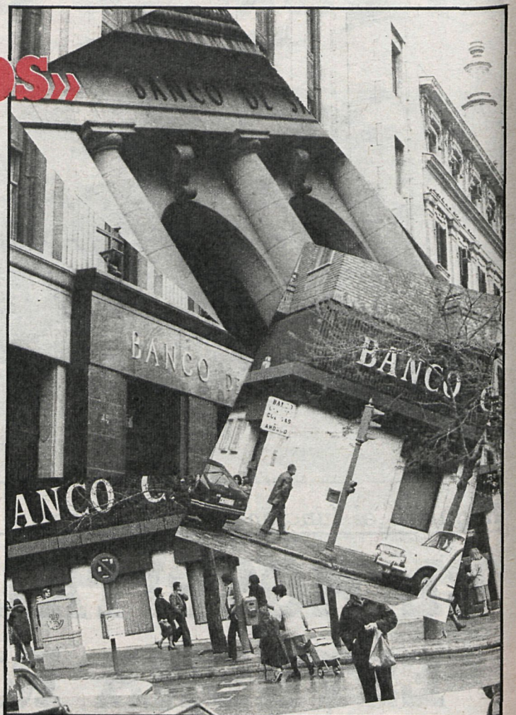
Las grandes dividendos repartidos por los bancos son consecuencia de la liberalización llevada a cabo por el Gobierno

Gracias, en parte, a la ayuda del Gobierno, los grandes han repartido unos beneficios entre sus clientes muy superiores a los de las últimas décadas