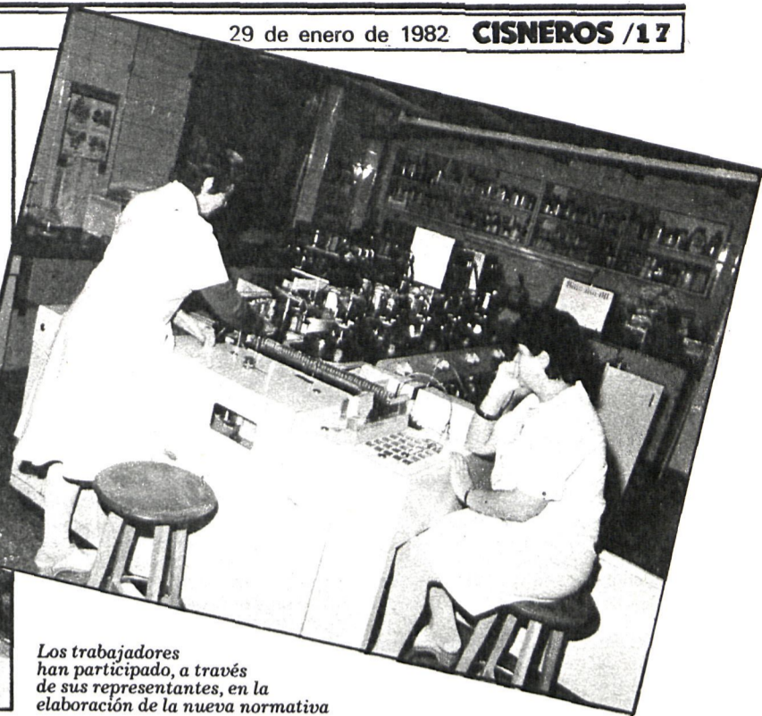
Los trabajadores han participado, a través de sus representantes, en la elaboración de la nueva normativa

Regulará el funcionamiento del centro médico de la Diputación