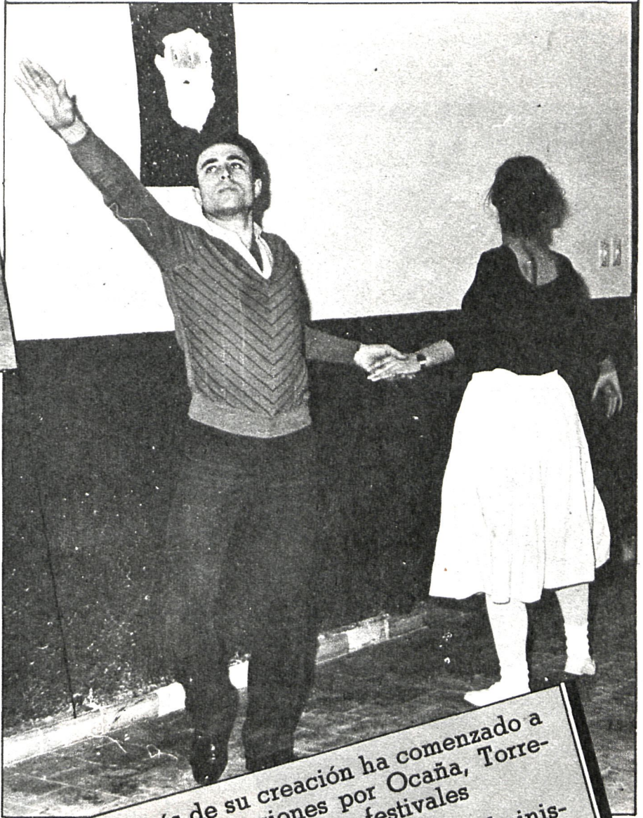
Parte del ballet, durante los ensayos

dirección de Ataúlfo Argenta y que ha representado en los mejores escenarios del mundo,