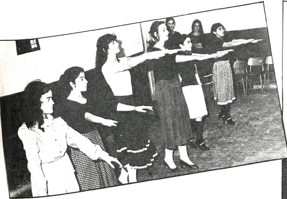
Lo forman cuarenta jóvenes del pueblo