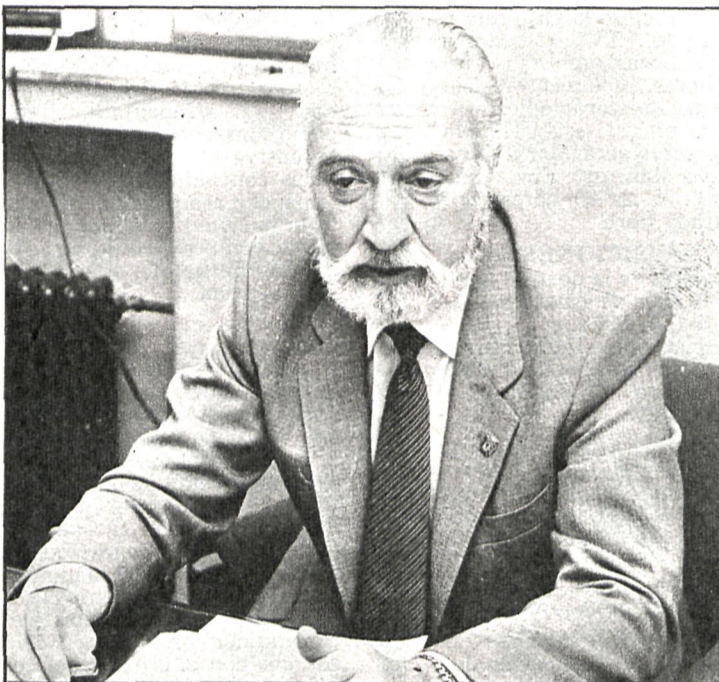
«Durante el pasado año en varios municipios se puso en marcha un plan piloto de sanidad escolar»

El diputado delegado de Sanidad justifica su postura, además, «porque hay que saber aceptar las decisiones políticas», y manifestó irónico