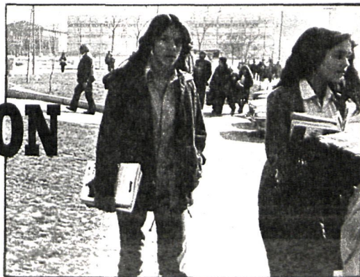
Tanto los jóvenes como los adultos de Leganés tienen una posibilidad más para ampliar sus conocimientos