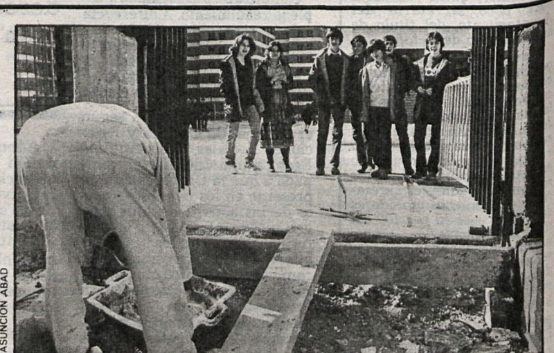
Los alumnos del colegio John Lennon contemplan durante el recreo cómo se realizan las últimas obras del centro

Aunque faltan algunas obras menores para su terminación