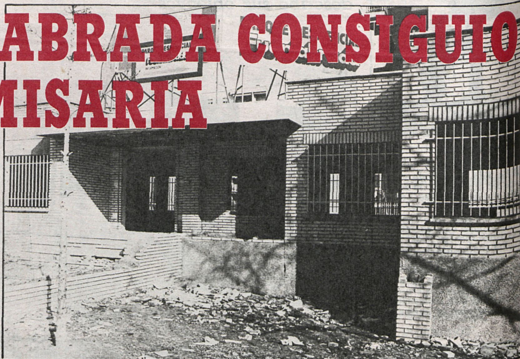
Este es el edificio, cedido por el Ayuntamiento, que se acondicionará para la instalación de la comisaría

La tan esperada comisaría de Fuenlabrada por fin va a ser construida. Un año y medio después de haberse concedido los terrenos para su ubicación, el Ministerio del Interior acaba de publicar una disposición en la que se constata la grata noticia para esta cada vez más populosa localidad. Habida cuenta de los graves problemas de seguridad que sufre la población, unido al alarmante aumento en el consumo de drogas y el paro juvenil, Fuenlabrada no podría esperar ni un día más sin contar con una comisaría.