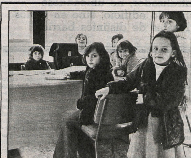
Los «peques», ya en sus aulas: terminó la peregrinación y el hacinamiento en otros colegios