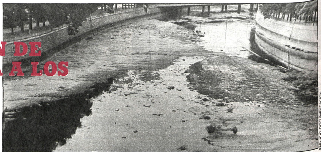
Durante el curso se exponen las técnicas existentes para evitar la contaminación de las aguas

—El programa básico se complementa con un ciclo de conferencias, con las que se pretende dar a los asistentes una visión global del problema de depuración de aguas, al objeto de que se pueda considerar el establecer las soluciones no sólo con las tecnologías clásicas