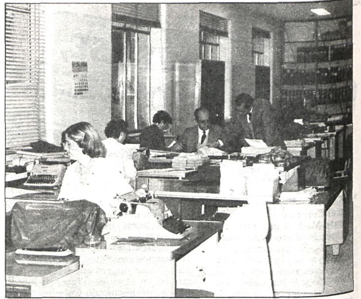
El convenio de los trabajadores laborales presenta numerosas novedades en el terreno social

Diputación sería todo lo flexible que fuera necesario para alcanzar el principio de treinta y siete y media horas semanales. Lo importante es que el principio está asumido y sobre esta base vamos a hablar. También podría ser asumido inicialmente un día más de vacaciones en Semana Santa y Navidad. Otro tema importante es el que se refiere a que la Diputación no ha conseguido presupuestariamente dotacio-