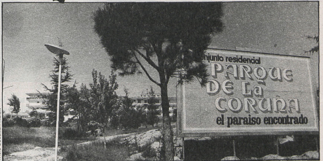
El parque de La Coruña no ha sido finalmente el paraíso que anunciaban los carteles

1.º Poner en conocimiento del gobernador civil de la provincia los hechos tal y como lo presentan los técnicos anteriormente referidos y formalizando por parte de este Ayuntamiento las correspondientes propuestas o denuncias que fuesen pertinentes.