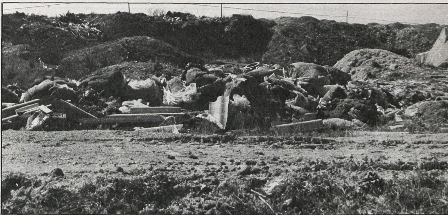
Montones de residuos de amianto se encuentran esparcidos en un radio de 150 metros.

El boletín se encuentra articulado en secciones que recogen informativamente cada una de las grandes áreas de acción municipal, además del espacio destinado habitualmente a opinión y un tema que, por su trascendencia importancia, es considerado tema del mes. En este primer número se ha concedido una especial atención al tema de la incorporación de los militantes de la ORT en el PSOE, cuyo trasvase «no provoca una crisis municipal», y se han destinado las páginas centrales a la explicación y desarrollo de los presupuestos municipales recientemente aprobados.