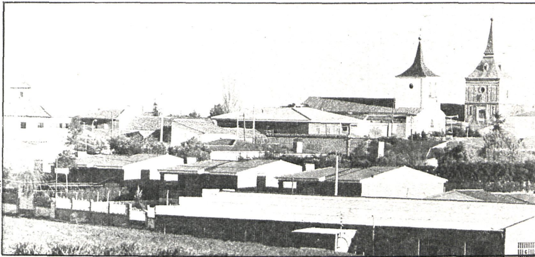
Sevilla la Nueva ha acogido con gran entusiasmo la noticia de la compra del palacio