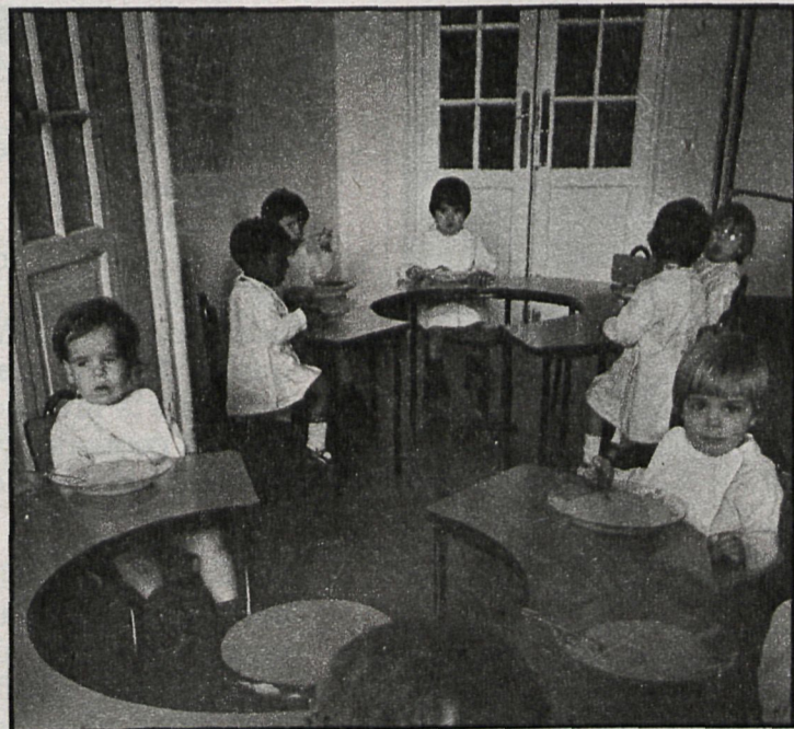
El nuevo centro municipal se suma a los ya existentes en la localidad y que pertenecen a instituciones privadas

Financiado por el Ayuntamiento, y con un coste total de 26 millones de pesetas, se ha iniciado en Arganda, tras varios meses de retraso sobre la fecha prevista, la construcción de un edificio destinado a guardería y centro de educación especial para subnormales, cuya terminación se prevé para el próximo mes de octubre