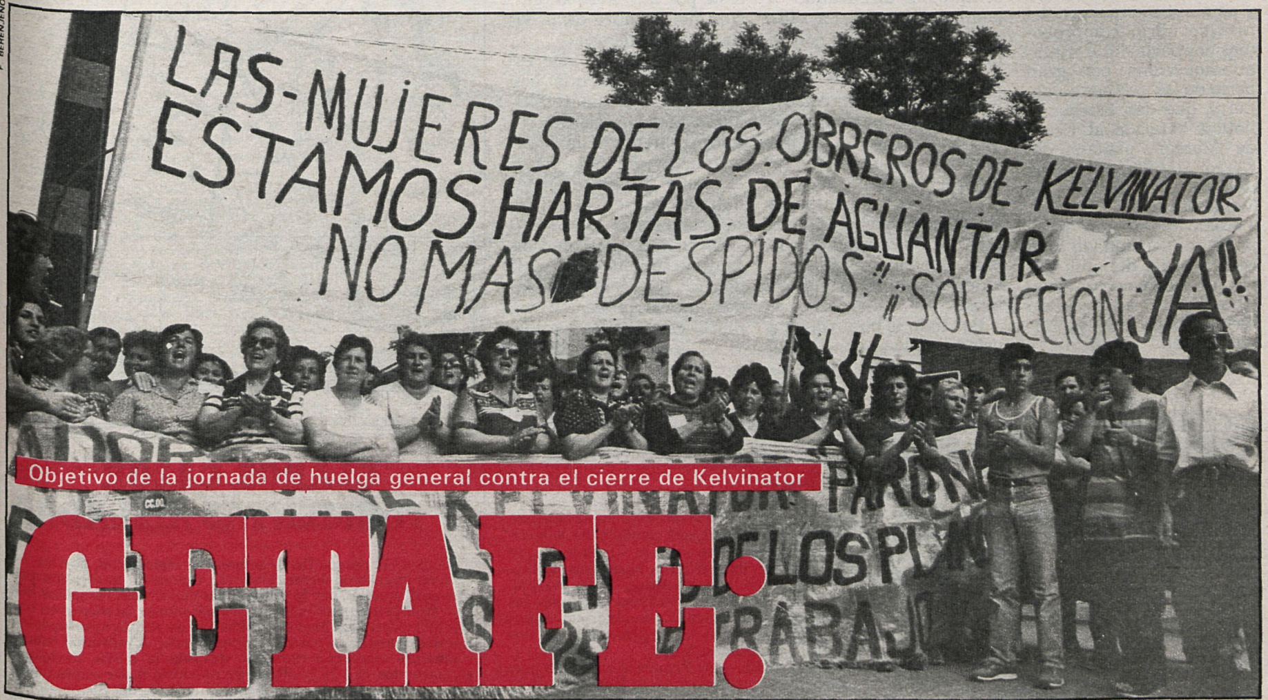
Objetivo de la jornada de huelga general contra el cierre de Kelvinator