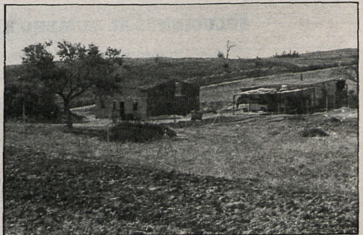
La medida municipal afectará a más de cien fincas