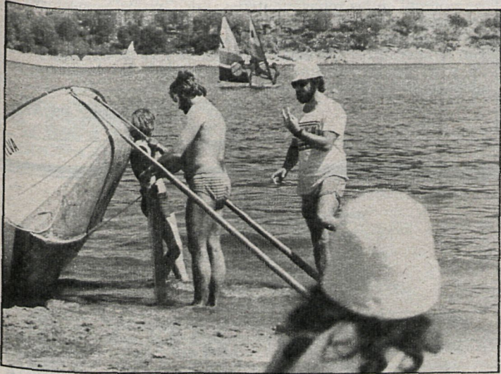
El 6 de junio se disputará el I Trofeo Reina Sofía, con asistencia de Sus Majestades