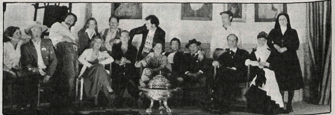
Los miembros del grupo teatral Candilejas durante una de sus representaciones

Debido a la escasez de recursos, la Asociación no cuenta con una sede social donde realizar sus actividades, y aunque hace pocas semanas un particular les cedió una vivienda antigua, dicha vivienda no