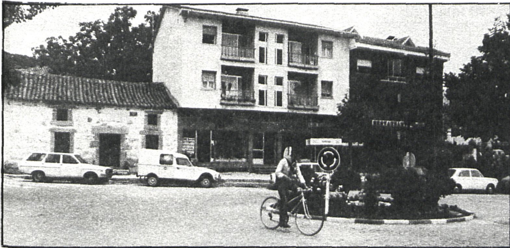
Los vecinos de Navacerrada se mantienen expectantes ante la posible llegada al pueblo de las selecciones del Mundial

la magnesita concedida a Productos Dolomíticos, S. A., de acuerdo a lo dispuesto en el artículo 178 de la vigente ley del Suelo, todo movimiento de tierras dentro del término municipal está sujeto a previa y preceptiva licencia y, consecuentemente, para iniciar las acciones previstas, tanto en la ley del Suelo como en el Reglamento de Disciplina Urbanística, es preciso cerciorarse que si los movimientos de tierra de la mina de magnesita se están produciendo dentro del término municipal y de acuerdo con el Plan de labores que Productos Dolomíticos, como concesionario de la explotación de magnesita, tiene aprobado por la Delegación de Industria.