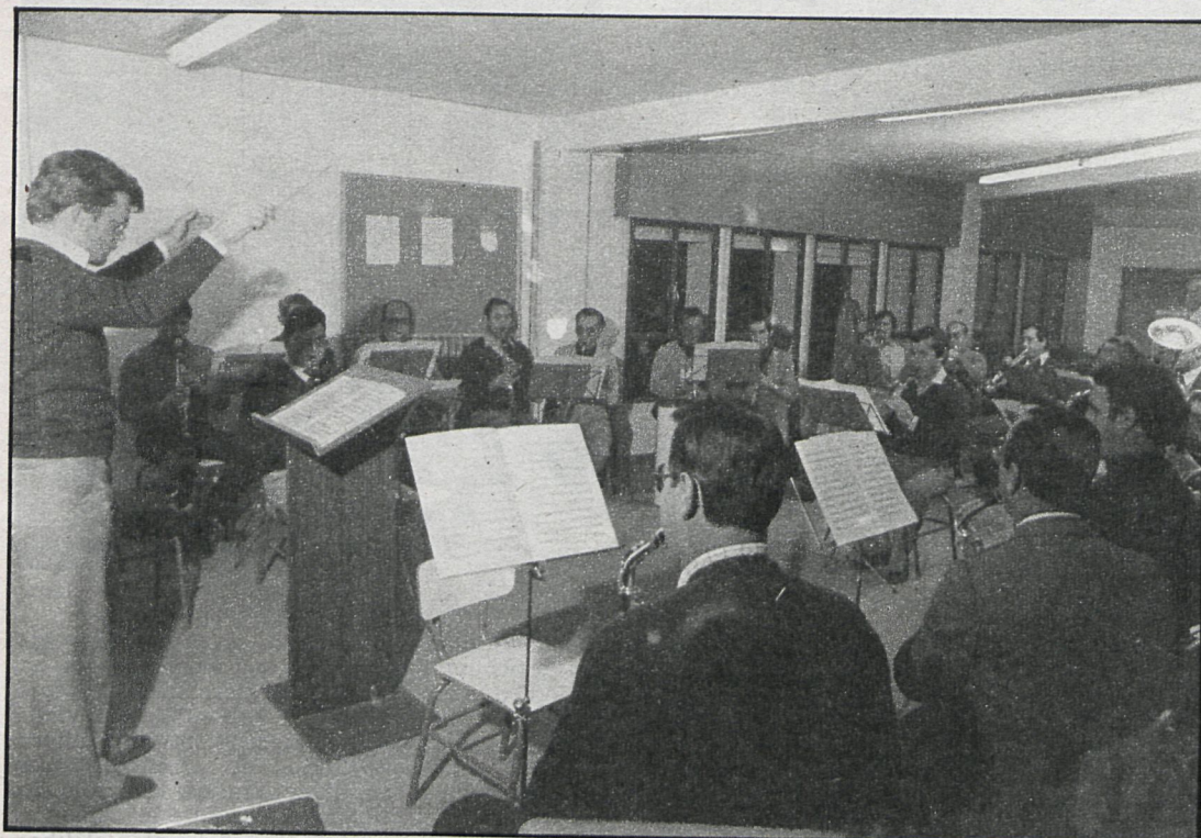
La educación de adultos abarca enseñanzas de todo tipo, desde el graduado escolar que se imparte en Fuencarral hasta la música y corte y confección, asignaturas que se dan en otros centros

L adulto hay que darle oportunidades durante toda la vida», afirman rotundamente cuatro de los profesores del centro de Educación Permanente de Adultos de Fuencarral. Oportunidad de reciclarse, de aprender, de adquirir cultura. Es algo que al parecer no está muy claro en España, o al menos así lo demuestra la situación en la que se encuentra el mencionado centro de EPA de Fuencarral.