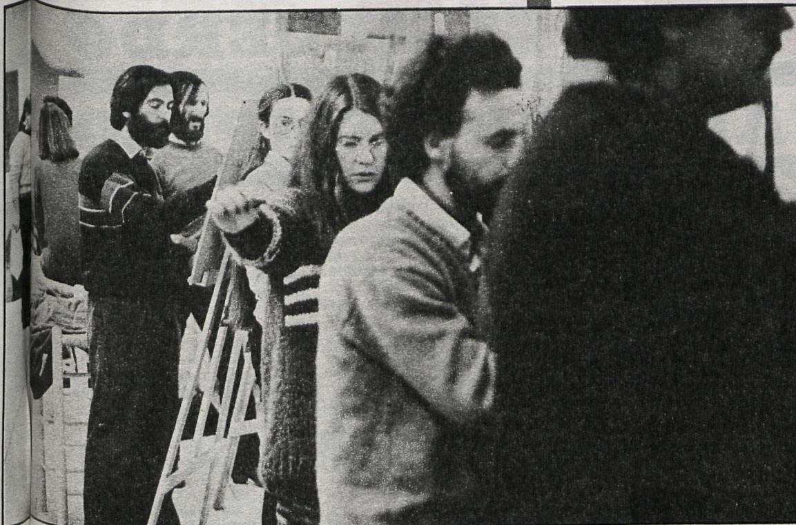
Debido a la escasez de centros de educación de adultos, el Ayuntamiento de Madrid mantiene abiertas diversas escuelas, de verano e invierno, una de cuyas clases vemos en la fotografía