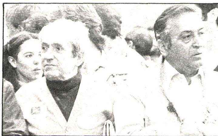
Marcelino Camacho y Nicolás Redondo, secretarios generales de Comisiones Obreras y UGT, respectivamente

Obreras han convocado unas jornadas de denuncia y de «advertencia para exigir un cambio en la orientación de la política del Gobierno y de la CEOE».