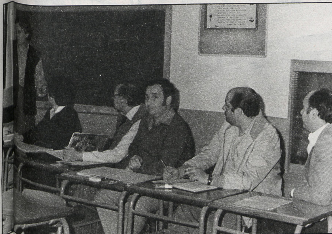
La edad no constituye un límite a la hora de sentarse en un pupitre y aumentar los conocimientos culturales

En la actualidad cursan estudios en el centro más de 600 alumnos