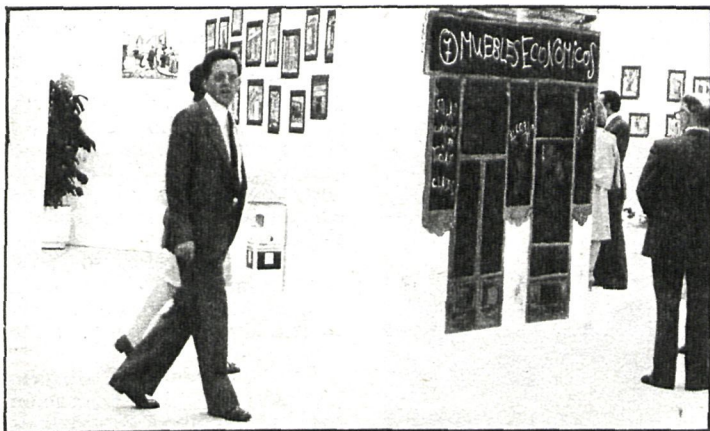
Un aspecto de la exposición, donde se recogen las características de nuestro comercio de ayer y de hoy

La fundamental característica de dicha zona seleccionada es quizá la de la gran variedad de matices y aspectos que presenta dentro de una indudable homogeneidad. Variedad ésta que fue debida al gran número de factores que la integraron y contribuyeron a su formación allá por los siglos XVII y XVIII, tanto en las construcciones nobiliarias y burguesas